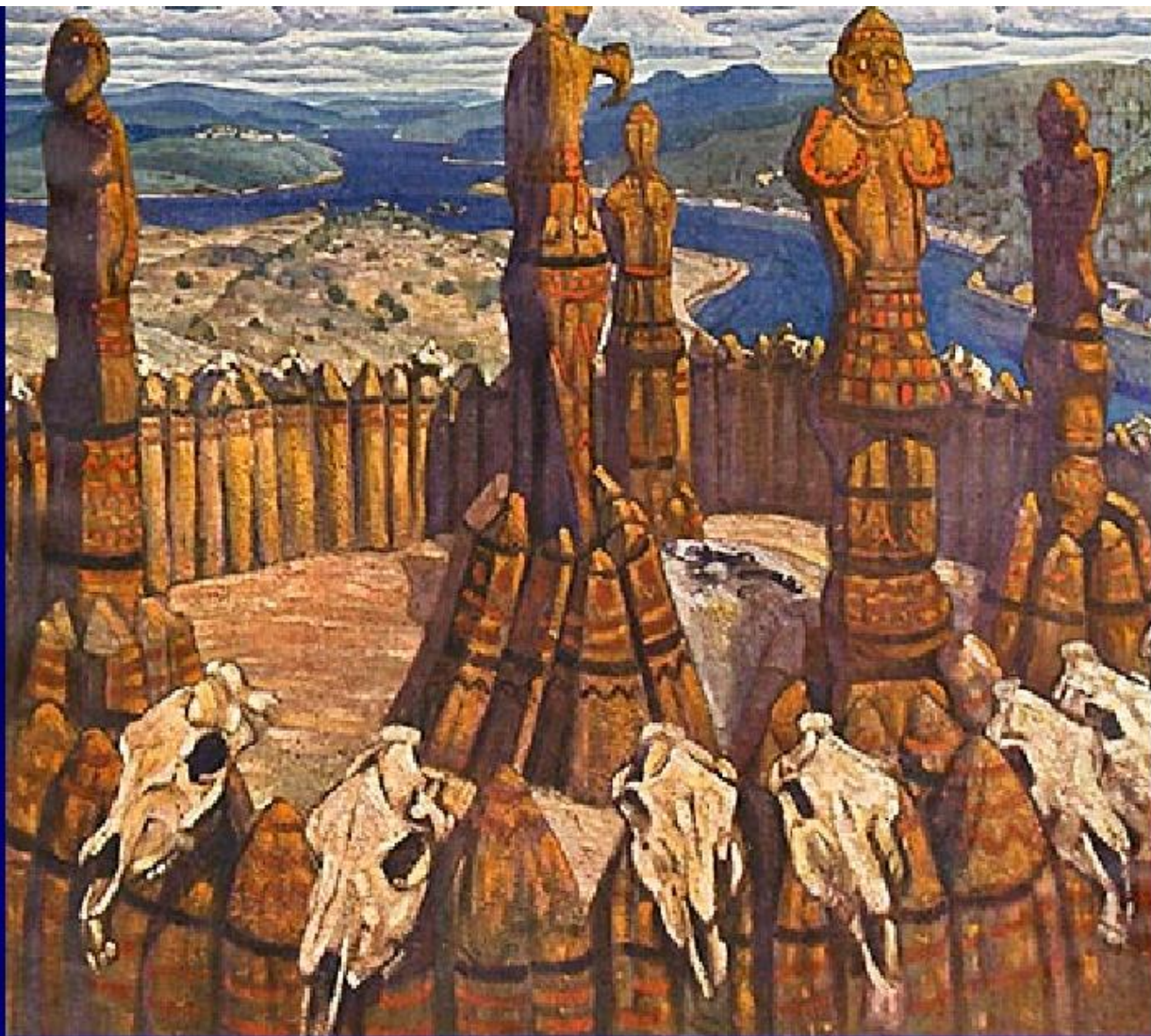
Н. Рерих "Идолы. Языческая Русь"