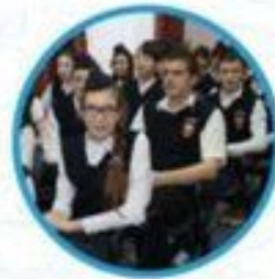
Юные помощники полиции