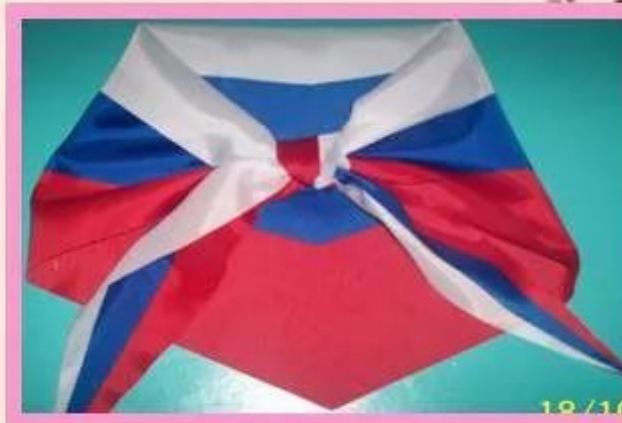
флаги РТ и РФ.