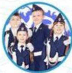
Юные инспектора движения