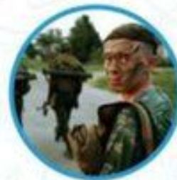
Юный спецназ Росгвардии