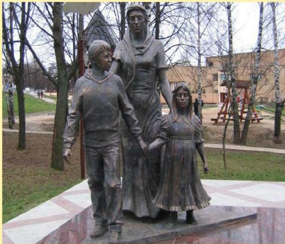
Памятник «Нашим матерям» в г. Видное.