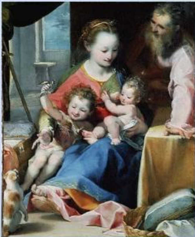
Рембрандт «Мадонна с младенцем И Св. Иосифом»

Женщина, мать стала воплощением кисти великих мастеров искусства: Рембранта, Венецианова, Тропинина, Серова.