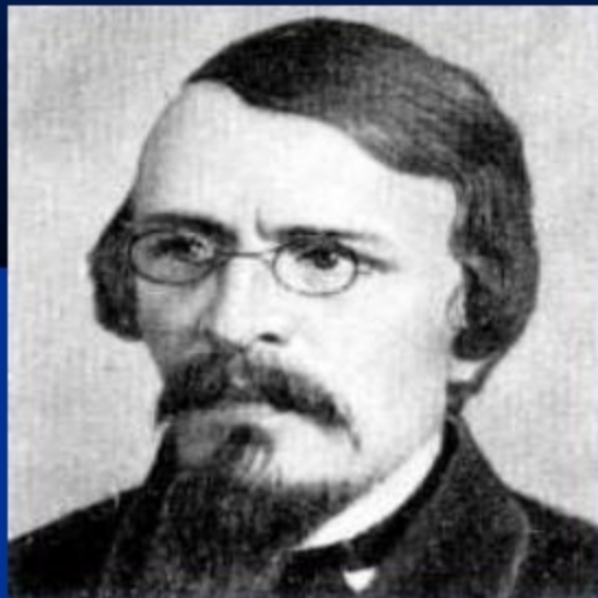
Михаил, старший брат Ф. М. Достоевского

Первым ребёнком в семье был Михаил, а вторым Фёдор.