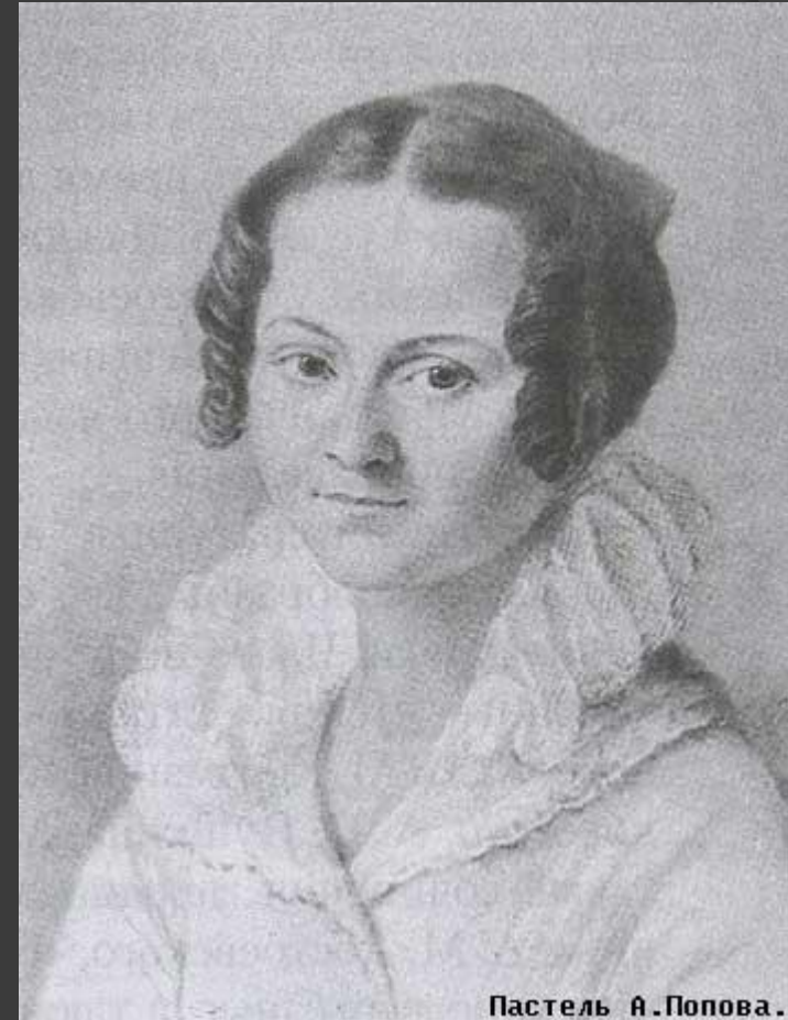
Пастель А. Попова.