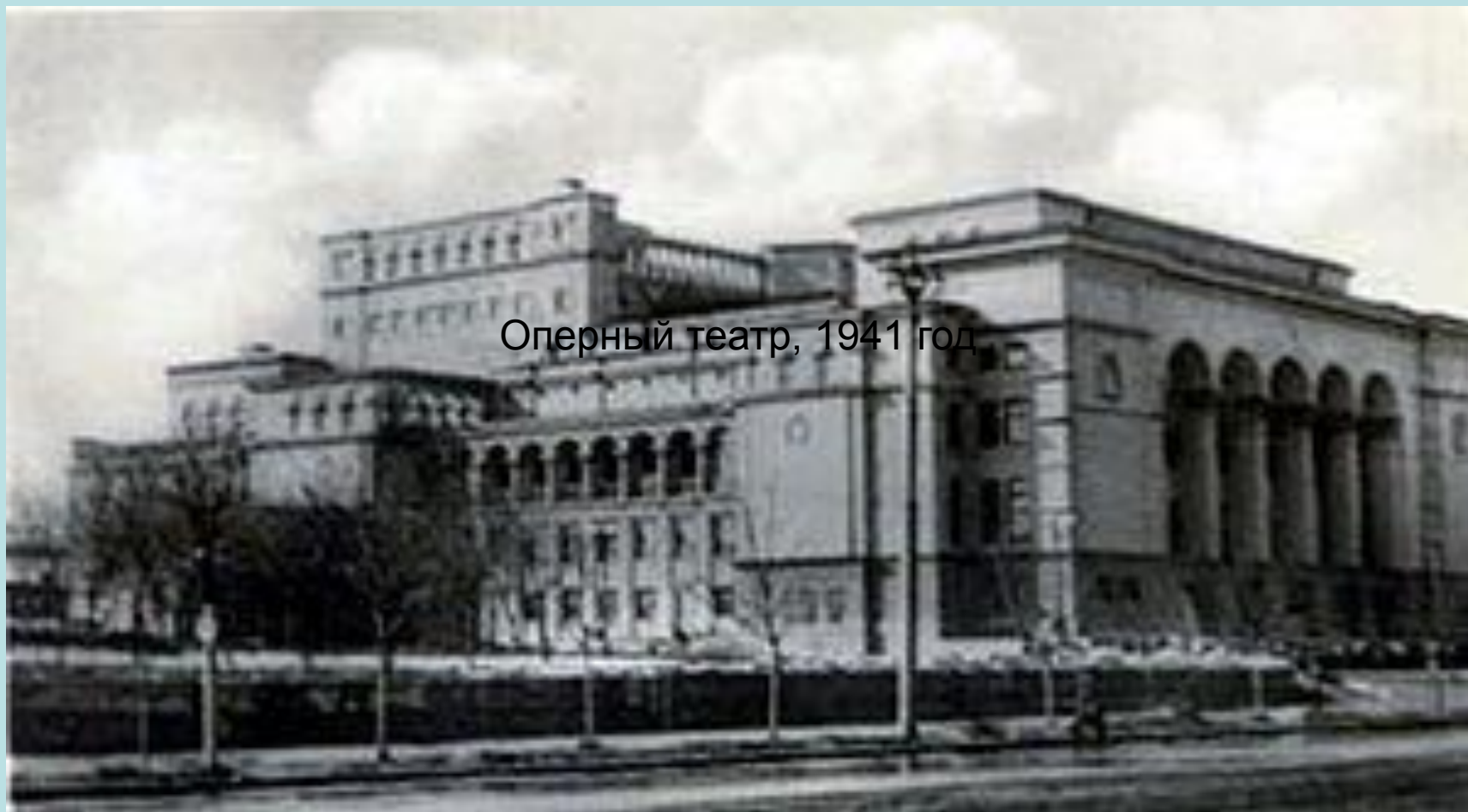
Оперный театр, 1941 год