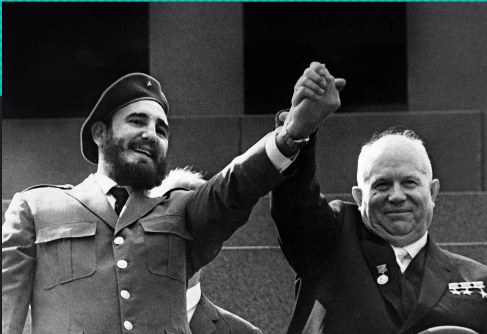
Ф. Кастро и Н.С. Хрущев