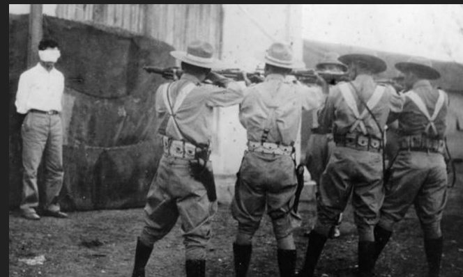
Куба в 1950-е годы