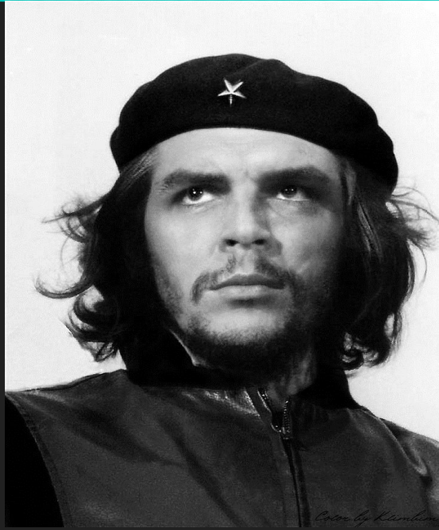
Эрнесто Че Гевара