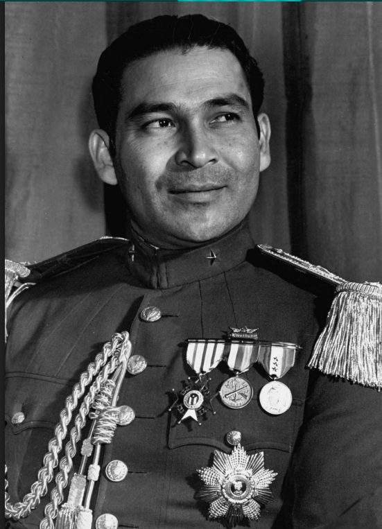
Рубен Фульхенсио Батиста