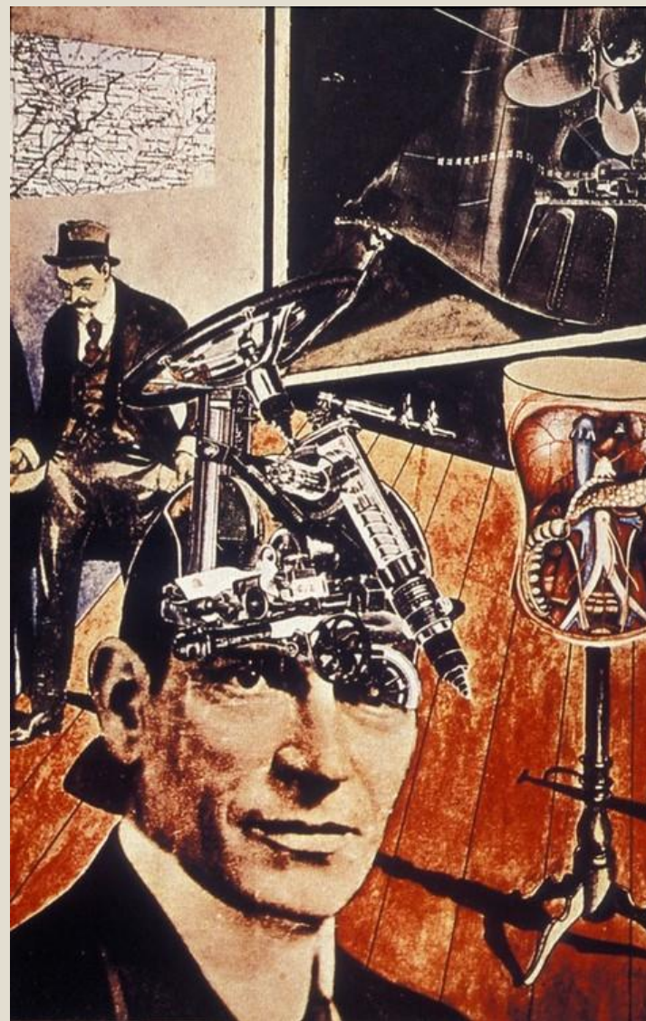
Рауль Хаусман «Татлин дома»