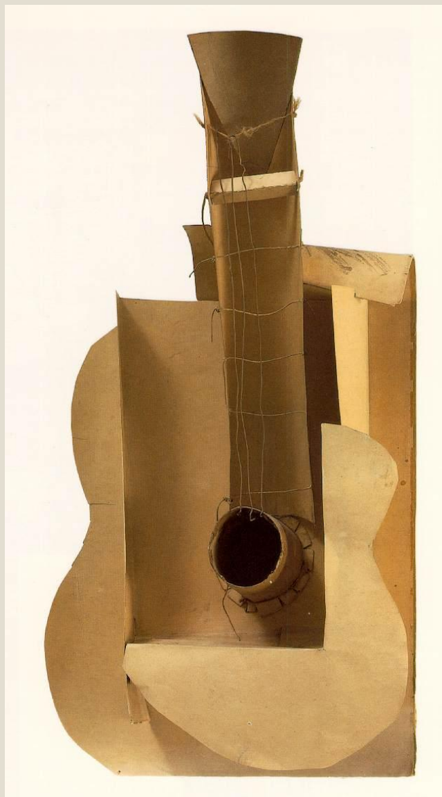
Пабло Пикассо «Гитара»