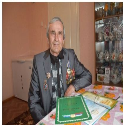
был в Чернобыле в 1986 году в числе первых ликвидаторов, работал механиком-водителем в радиационной зоне.