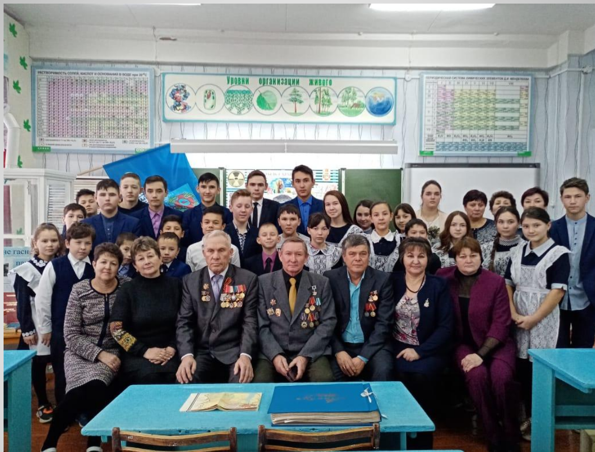
Тёплая встреча в МОБУ СОШ с. Мустафино