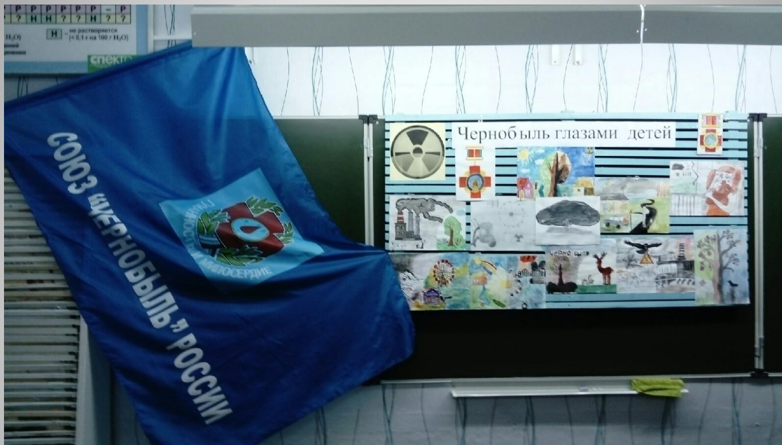
Знамя союза «Чернобыль» России