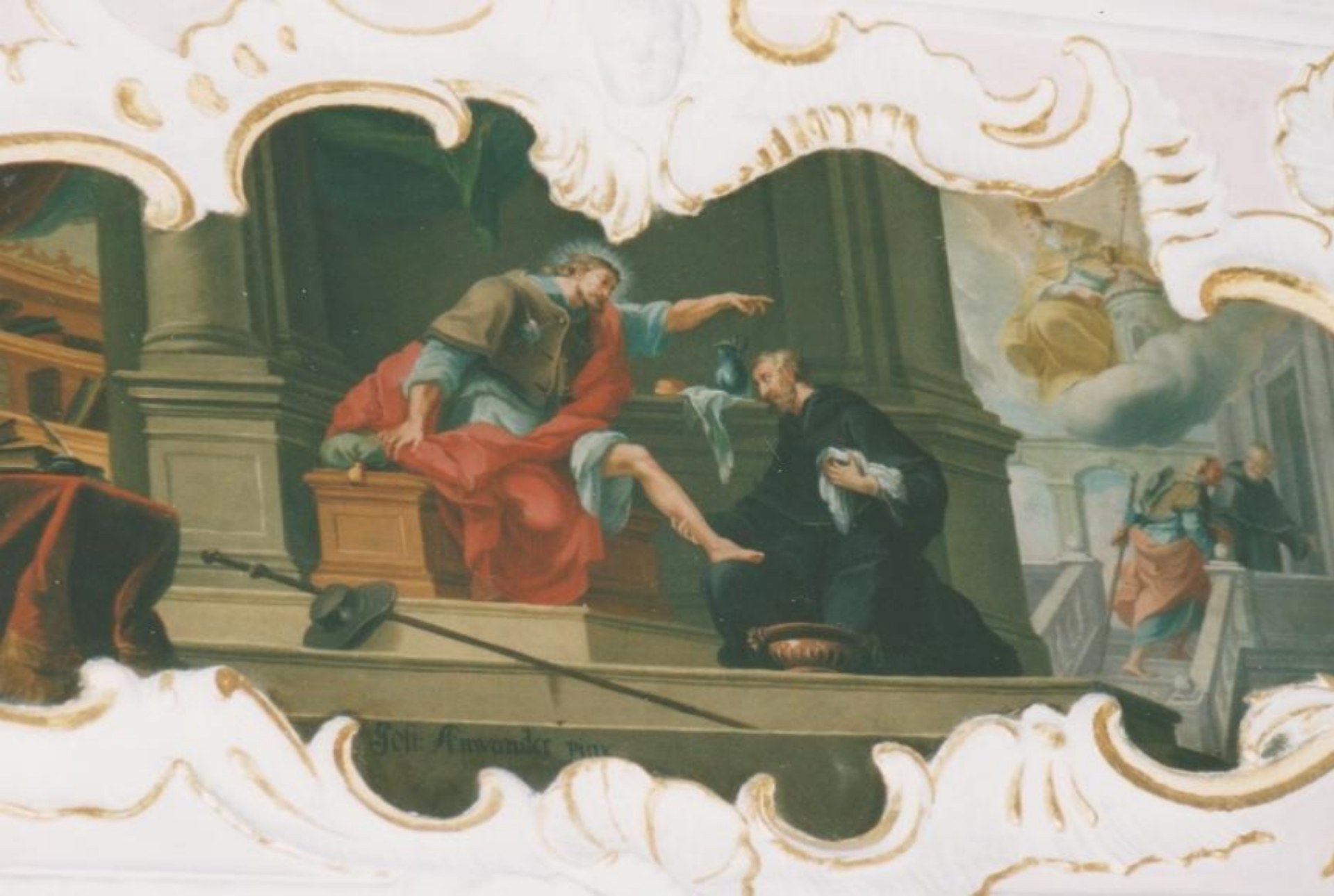
В асимметричной раме с рокайлями