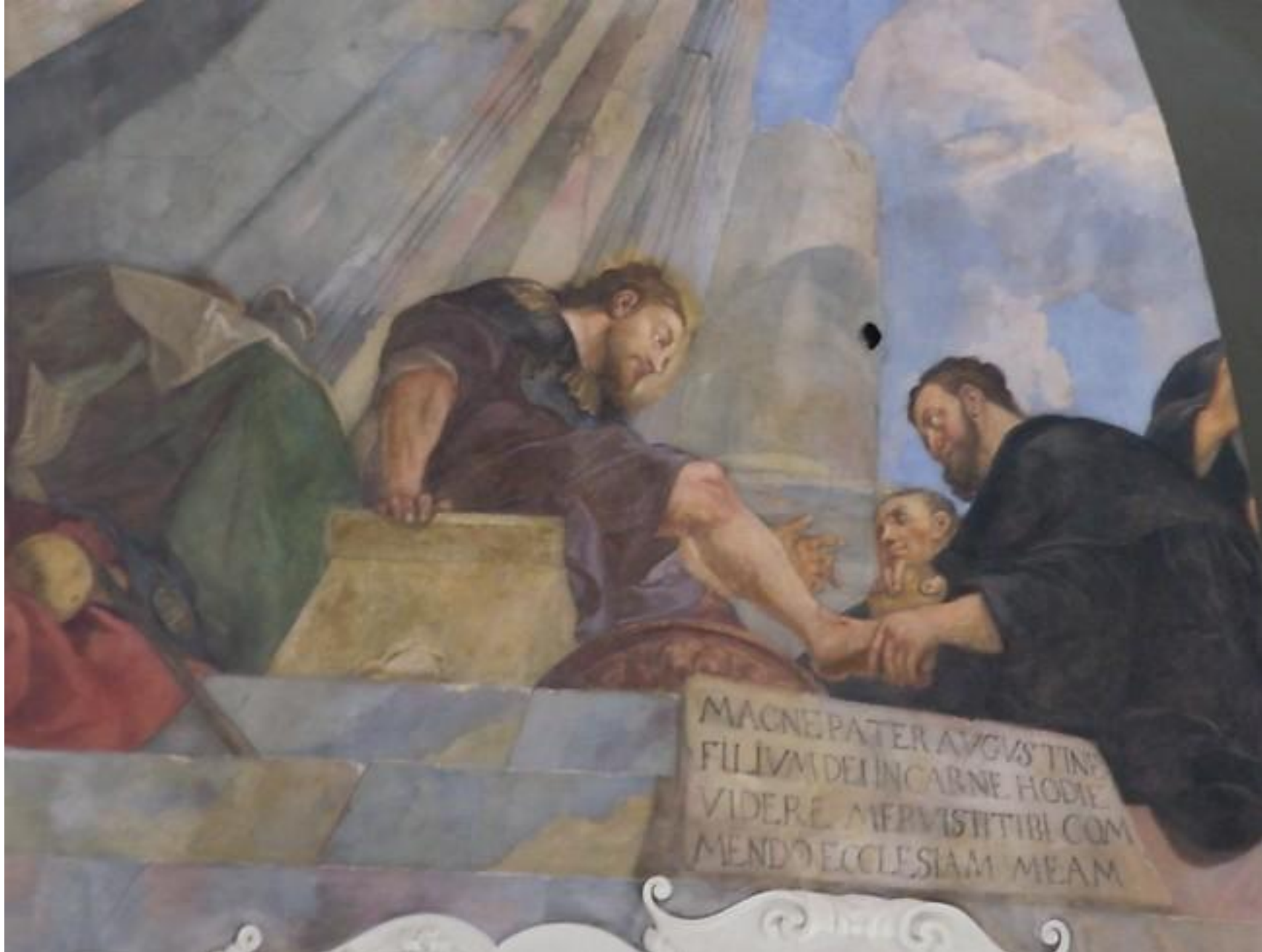
И еще головокружительная Scheinarchitektur. Вацлав Вавринец Райнер (1728-1730)