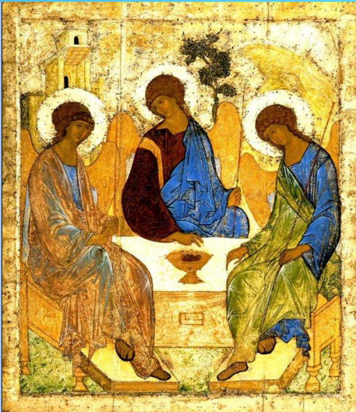
АНДРЕЙ РУБЛЕВ ТРОИЦА (НАЧ. XV В.)