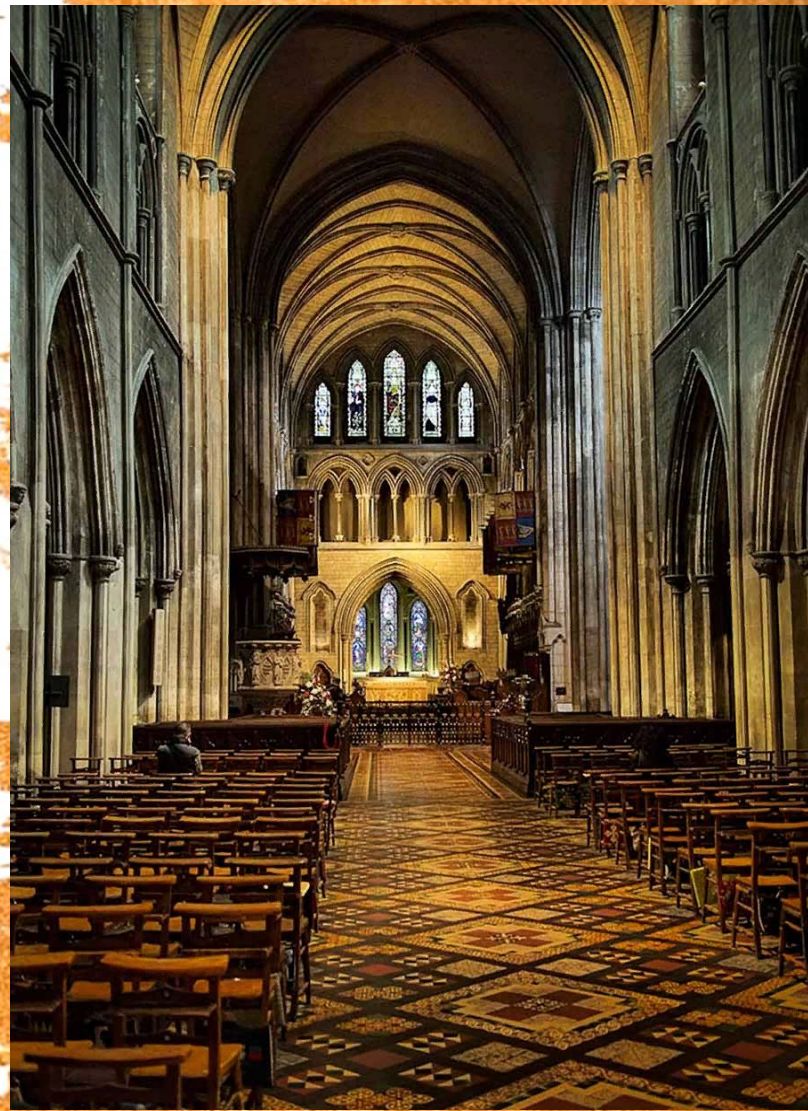
Собор Святого Патрика в Дублине