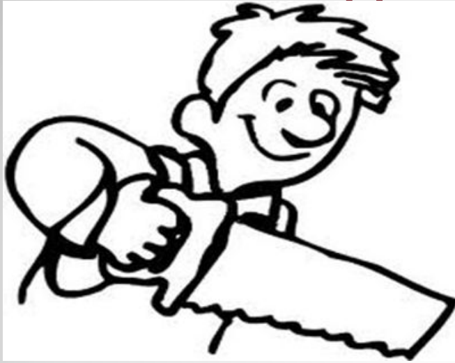
Рисунок 1 Бук