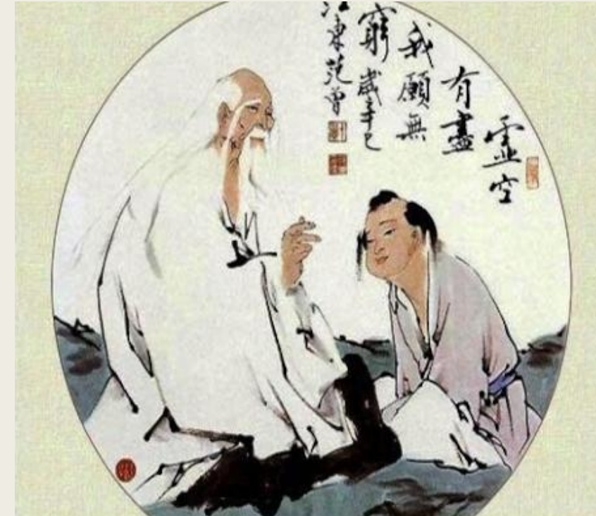
Конфуций с учеником