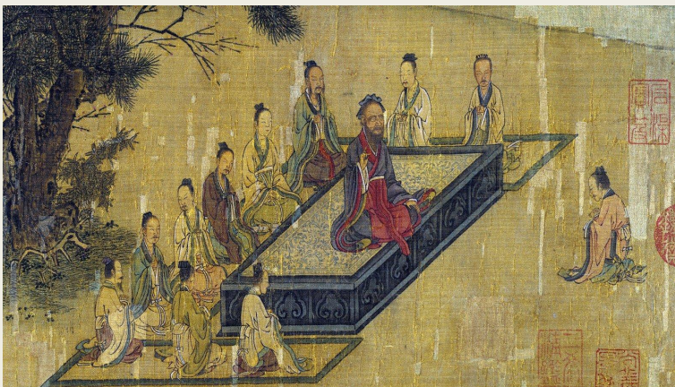
Конфуций с учениками