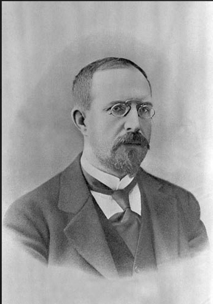
Рябушинский Павел Павлович (1871-1924)