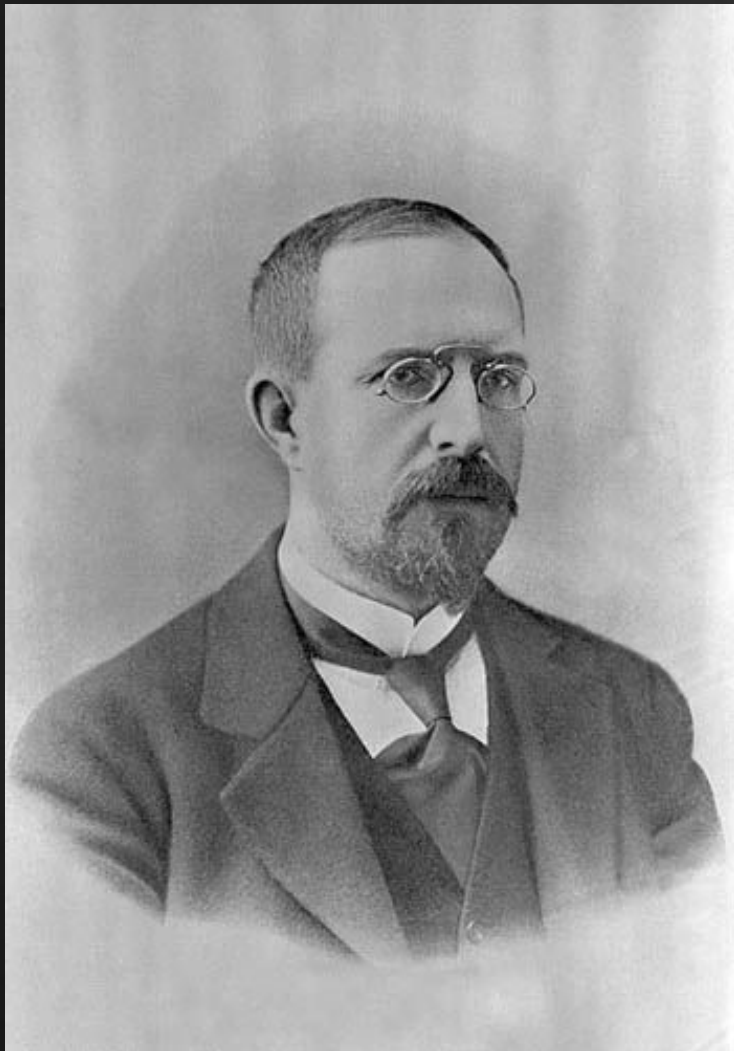
Рябушинский Павел Павлович (1871-1924)