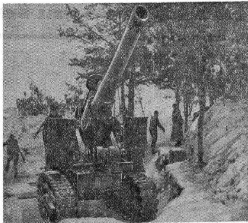
Кадр из кинофильма «Разгром немецких войск под Москвой». Тяжелое орудие на огневой позиции.

Разгром полчищ немецких бандитов под Москвой в фильме обрисован с исключительной яркостью. Я — старый человек,