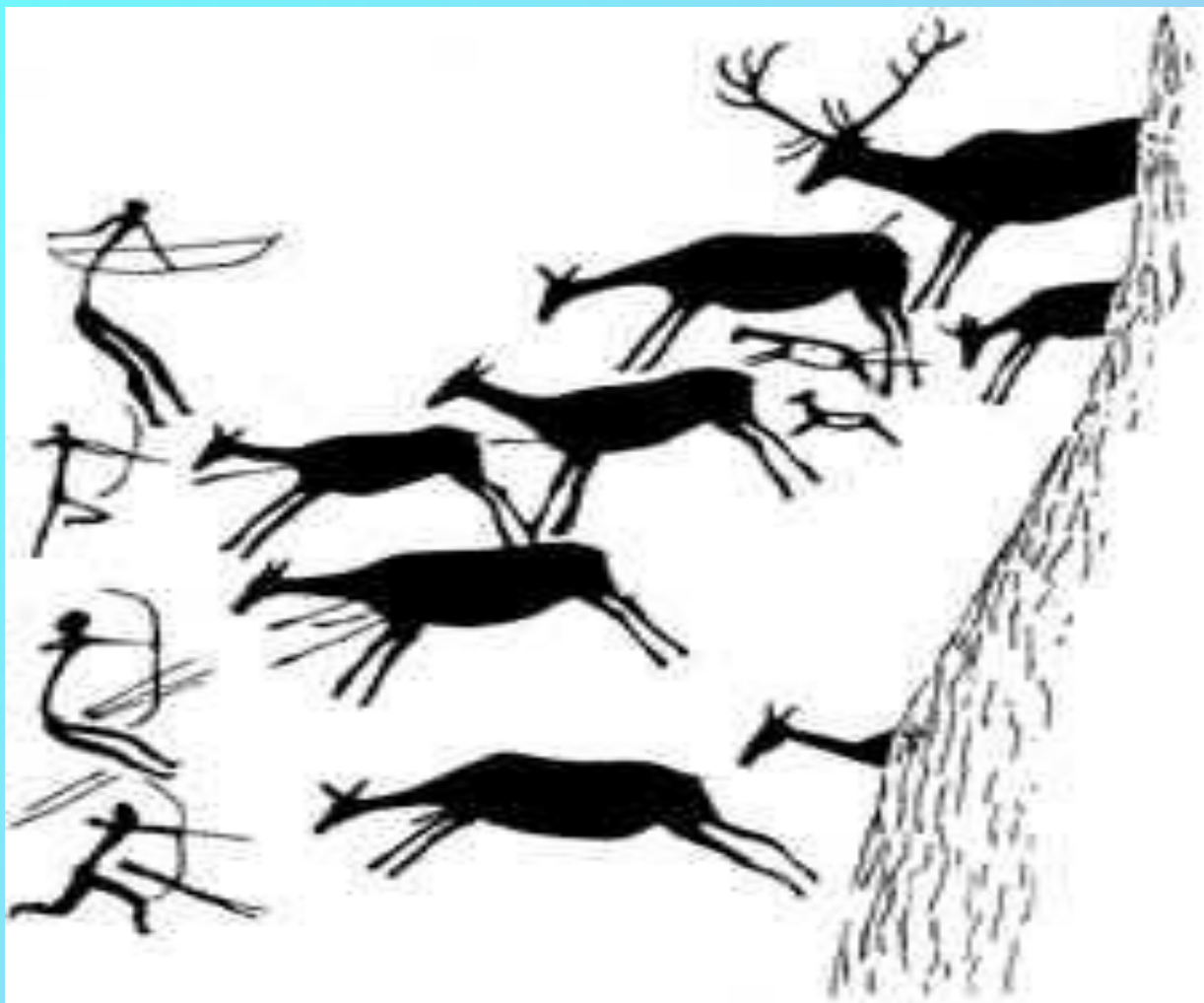
Пиктография. Охота на оленей. Наскальная живопись. Испания