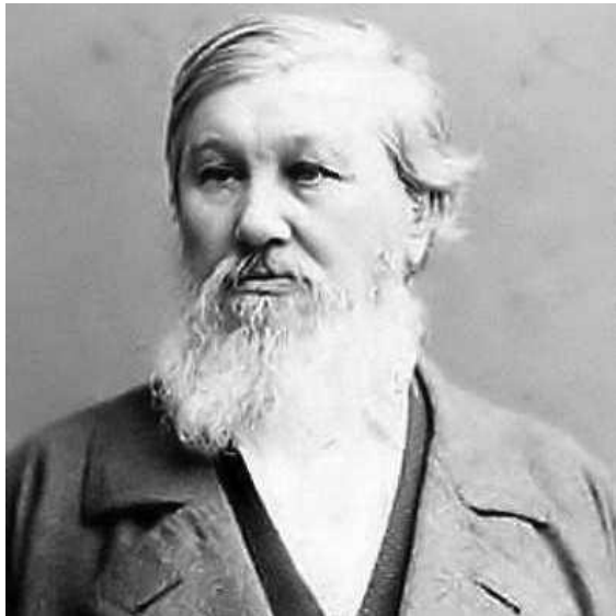
Н. Я. Данилевский

«Цивилизация – это неповторимый культурно-исторический тип общества, характеризующийся универсальным стилем различных сторон человеческой жизнедеятельности»