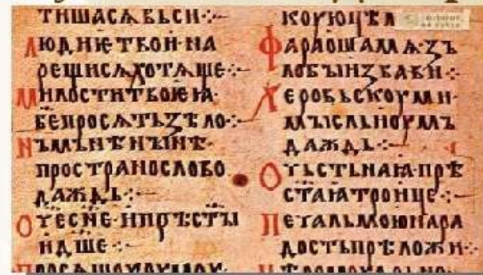
Фрагмент «Азбучної молитви»

Кирило і Мефодій заклали основи слов'янської писемності. Оригінали їх творів не збереглися. Кирила учені вважають автором «Азбучної молитви», «Пролога до Євангелія»; Мефодія – гімну на честь Дмитра Солунського.