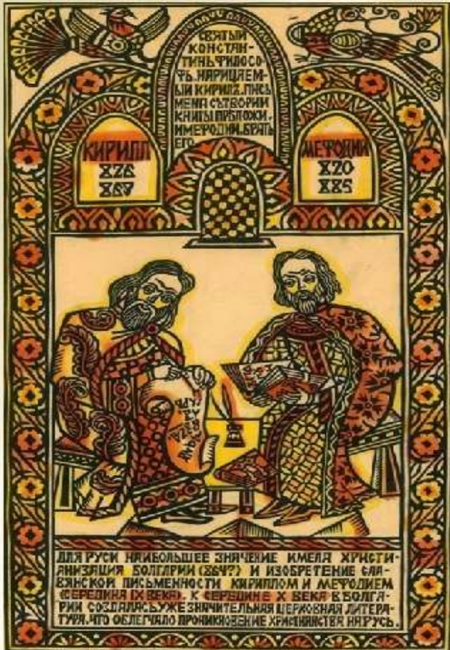
Олена Старовойтова «Кирило і Мефодій». Лубок, ліногравюра.

Кирило і Мефодій заклали основи слов'янської писемності. Оригінали їх творів не збереглися. Кирила учені вважають автором «Азбучної молитви», «Пролога до Євангелія»; Мефодія – гімну на честь Дмитра Солунського.