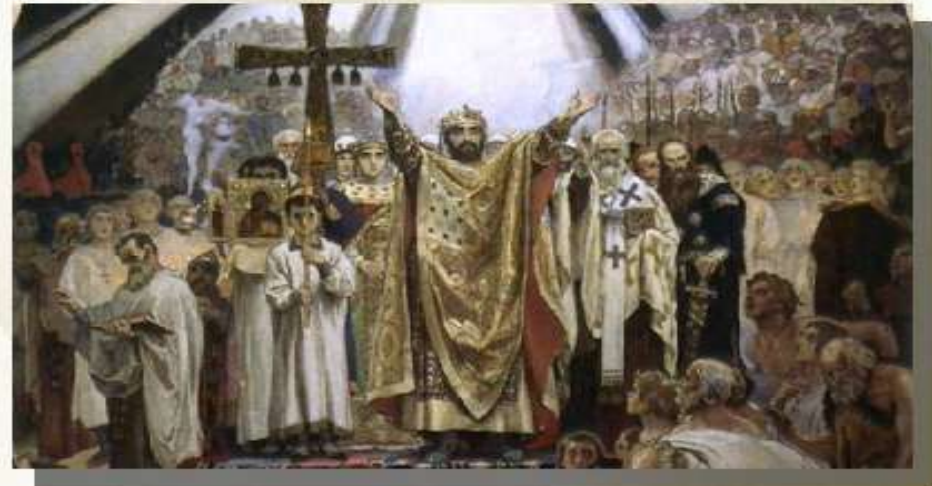
Васнецов В. «Хрещення Русі»