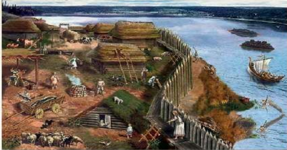
Городище давніх слов'ян на березі річки