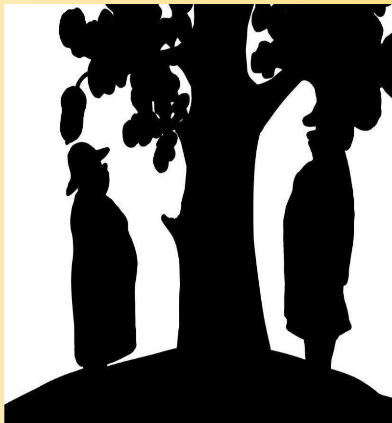
РОЖДЕСТВЕНСКАЯ ОЛЬГА НИКОЛАЕВНА