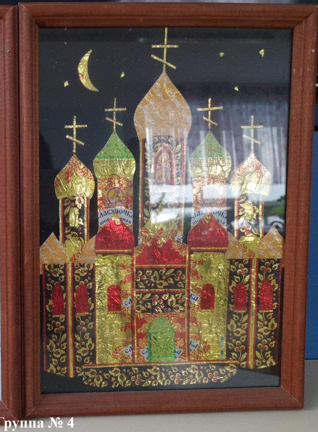
Группа № 4