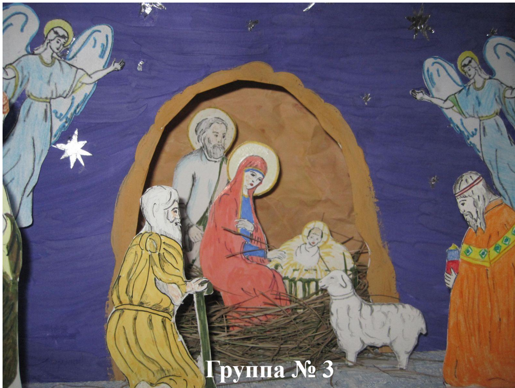
Группа № 3