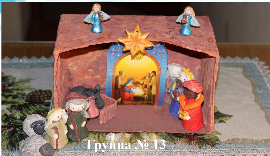
Группа № 13