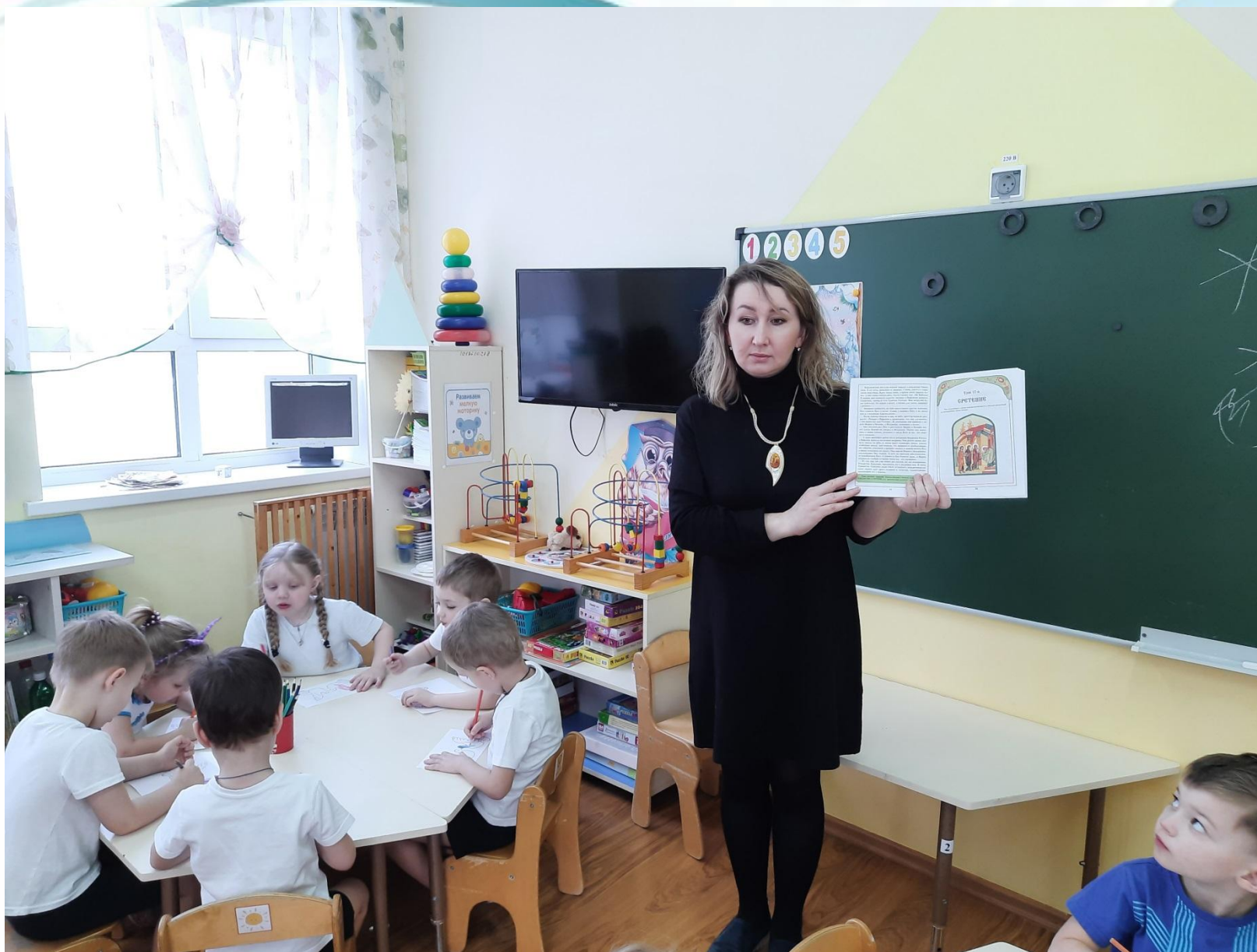
Рассказ о празднике на занятии