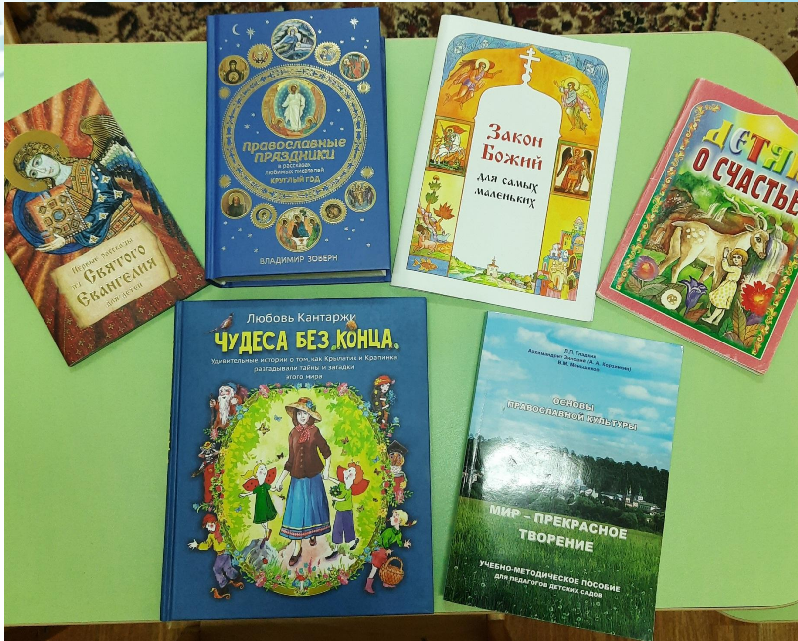
Литература, используемая в работе с детьми дошкольного возраста