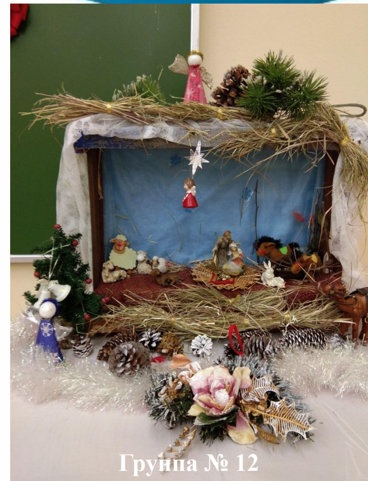
Группа № 12