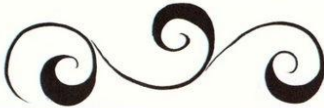
ВЕДУЩИЙ СТЕБЕЛЬ — «КРИУЛЬ»