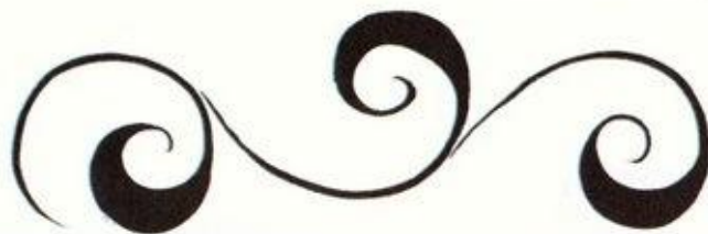
ВЕДУЩИЙ СТЕБЕЛЬ — «КРИУЛЬ»