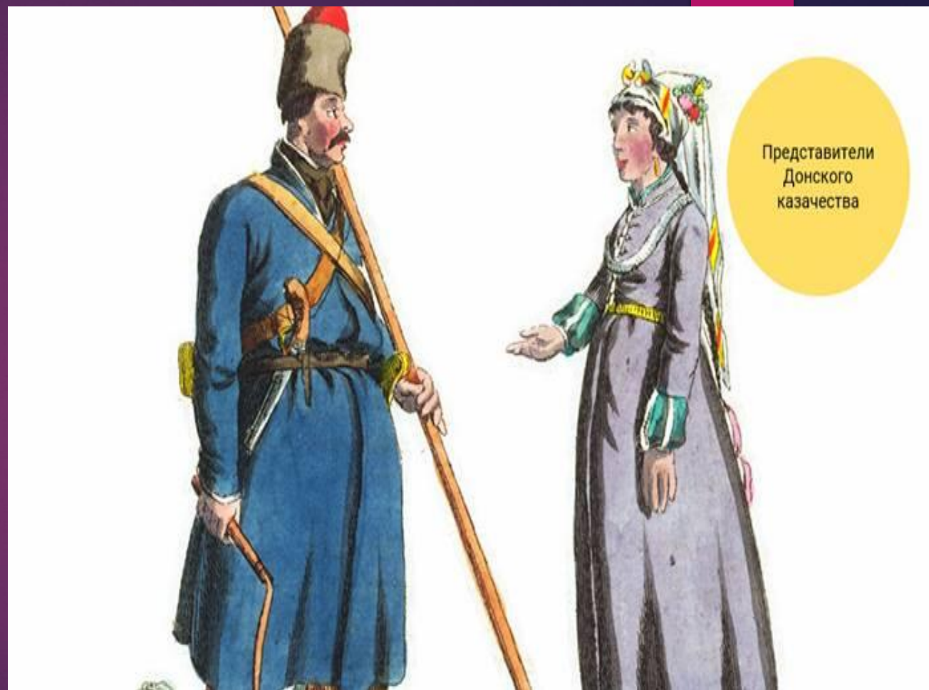
Представители Донского казачества

Однако коренные жители присоединённых к России земель испытывали на себе и негативное влияние. Народы Сибири узнали о новом для себя напитке – «огненной воде». Сейчас мы называем его «водка». За бесценнок русские скупали у местных дорогие меха. Около 15 % населения России были украинцами. Киев и Левобережная Украина сохраняли самоуправление. Контроль над этой территорией Москва осуществляла через гетманов, находившихся во главе казачьего войска. В то же время независимыми оставались финансовая и судебная системы Украины. Казаки были известны своей любовью к свободе. Их вольный дух в значительной степени мешал укреплению центральной власти.