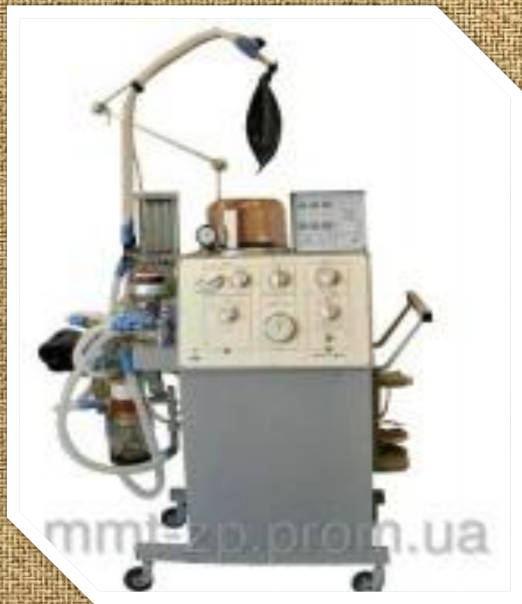
Аппарат ИВЛ MVP-10