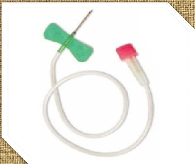
Игла бабочка, для капельницы.