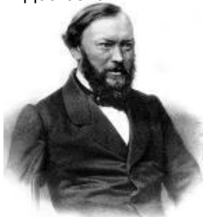
Александр Николаевич Островский