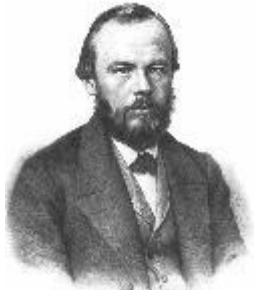
Федор Михайлович Достоевский

В особняке в Петроверигском переулке размещалась знаменитая картинная галерея Кокорева - первая российская публичная картинная галерея. В музее были собраны произведения Айвазовского, Брюллова, Боровиковского и других известных российских художников.