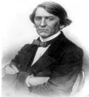
Алексей Николаевич Плещеев