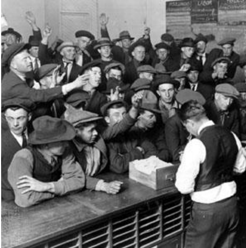
На бирже труда