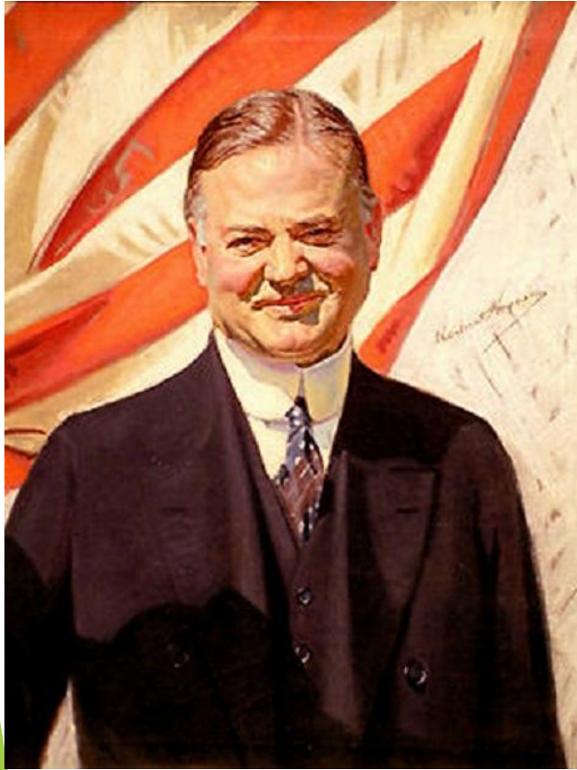
Герберт Кларк Гувер