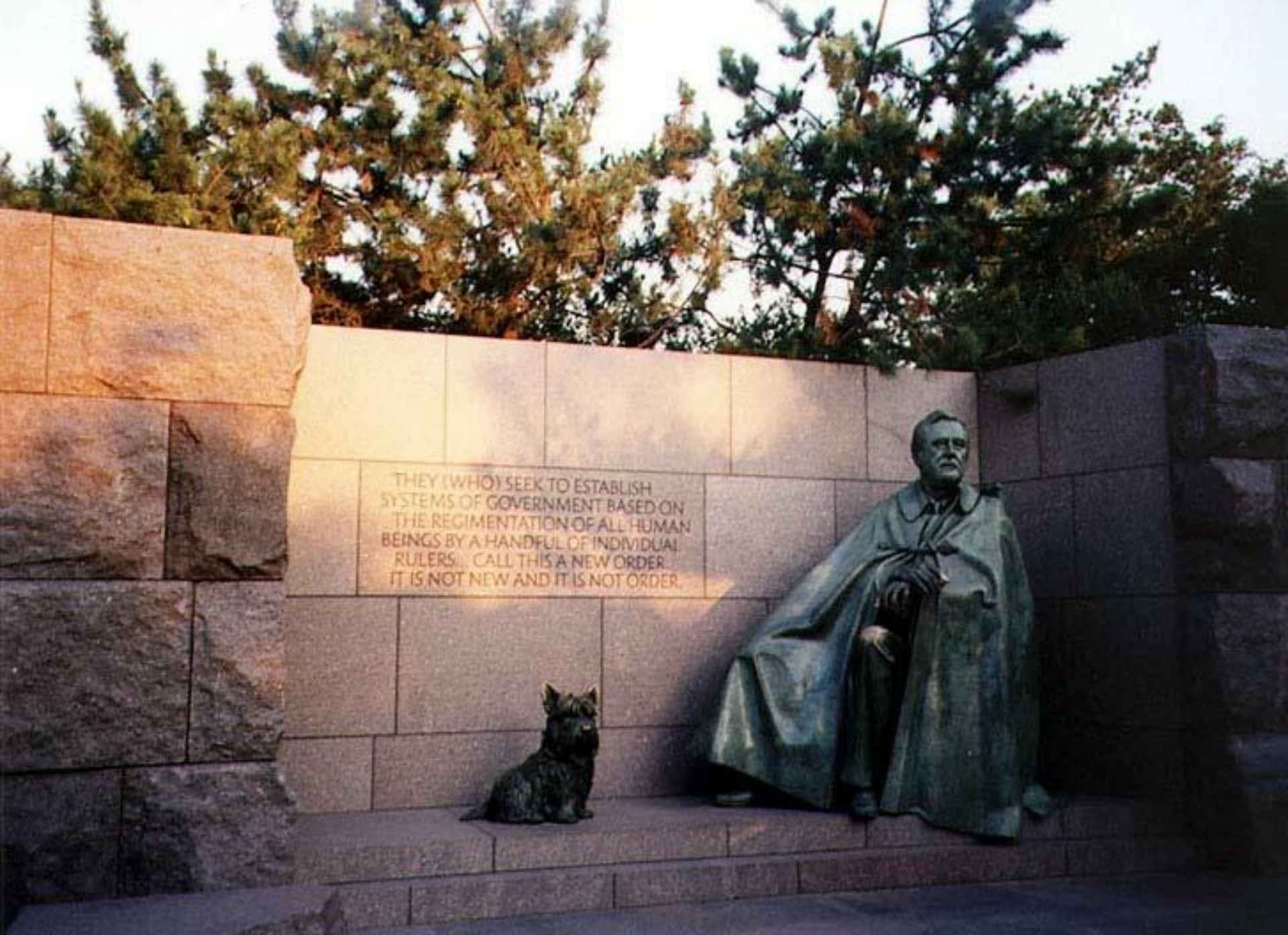
Вашингтон. Мемориал Франклина Рузвельта.