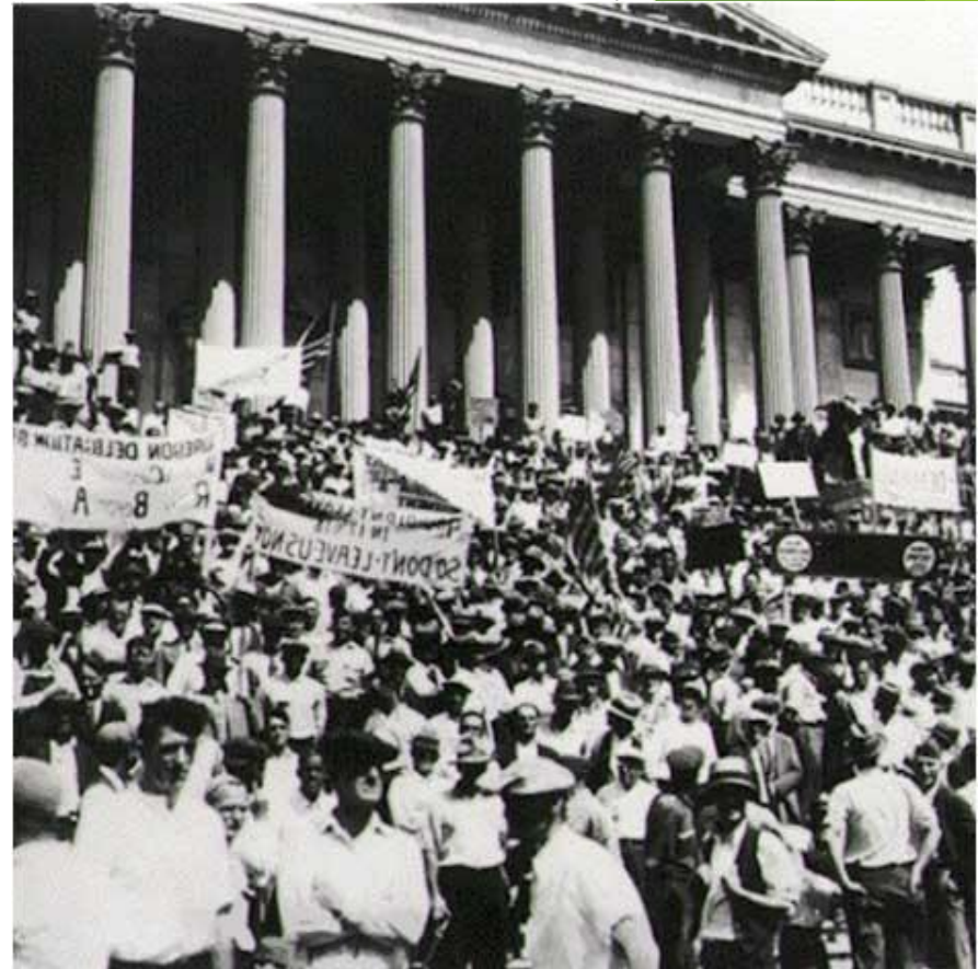
Демонстрация. Вашингтон 1932г