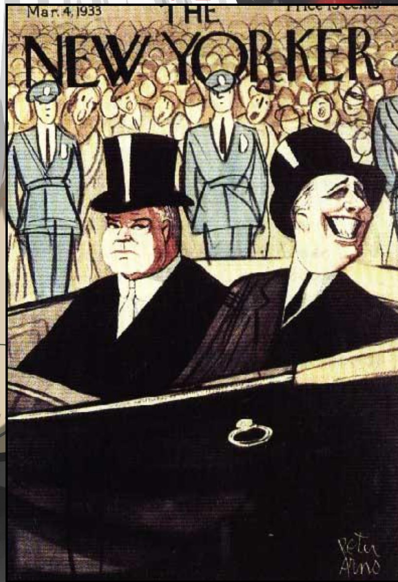
Гувер и Рузвельт