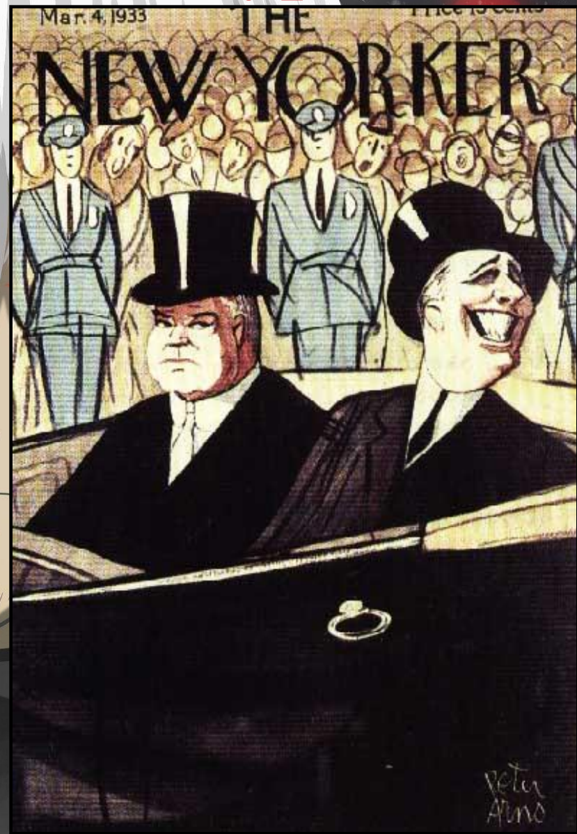
Гувер и Рузвельт