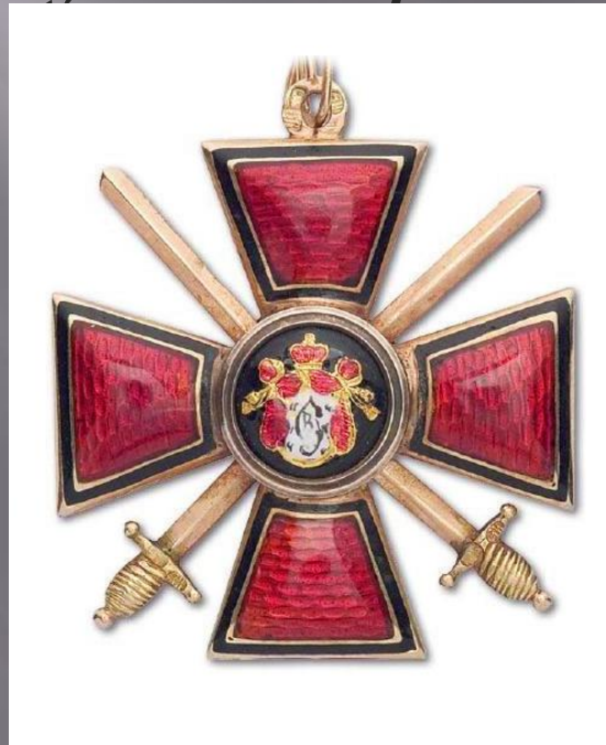
Императорский орден Святого Равноапостольного князя Владимира IV степени

Ф.Ф. Ушаков свою первую награду – орден Святого Владимира IV степени (1783) получил за успешную борьбу с эпидемией чумы в Херсоне