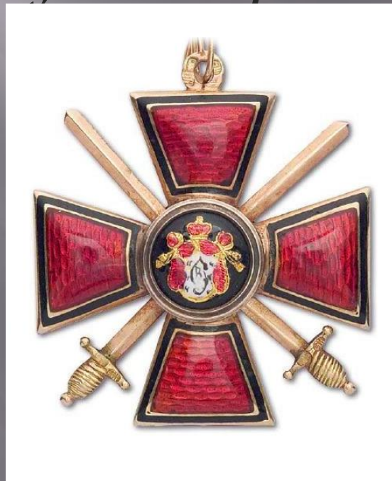
Императорский орден Святого Равноапостольного князя Владимира IV степени

Ф.Ф. Ушаков свою первую награду – орден Святого Владимира IV степени (1783) получил за успешную борьбу с эпидемией чумы в Херсоне