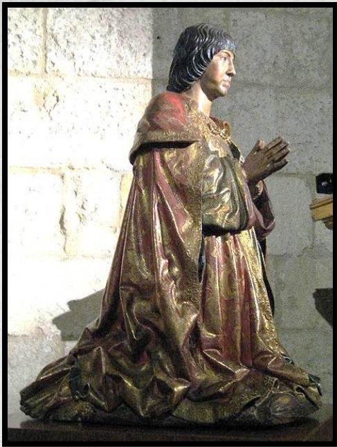
Скульптура молящегося Фердинанда в Королевской Капелле

Фердинанд и Изабелла называли себя католическими королями. Они мечтали сделать Испанию чисто христианской страной. Всех оставшихся мавров и евреев заставляли принимать крещение.