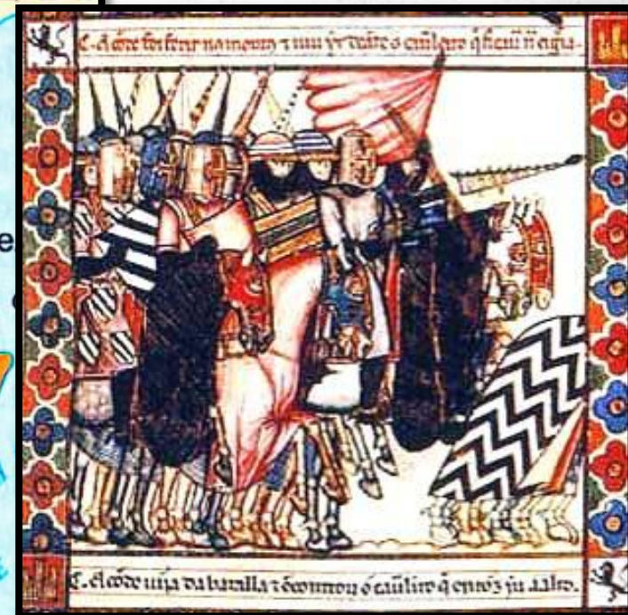
Король Альфонс VIII Кастильский в битве при Лас-Навас де Толоса. Средневековая миниатюра