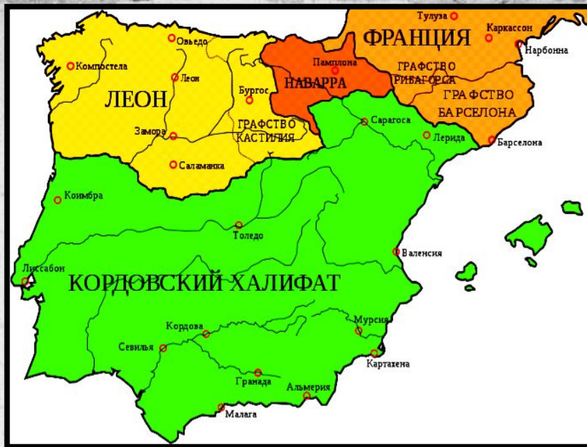
Испания в 1000 году

Сразу же после завоевания маврами Испании началась Реконкиста — обратное отвоевание захваченной территории.