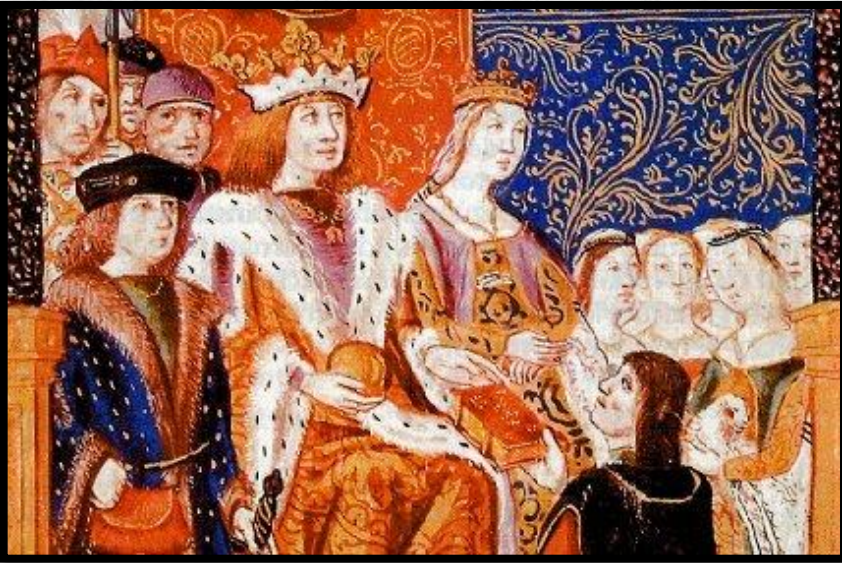
Фердинанд и Изабелла со своими подданными

Будучи годом старше своего мужа, Изабелла была известна красотой, умом, энергией, возвышенным и непреклонным характером, отличалась упорством, богобоязненностью и самонадеянностью. Она проводила время то в походах, где, сидя на лошади, сама нередко командовала отрядами, то в кабинете, где вместе со своими секретарями занималась чтением и составлением государственных бумаг.