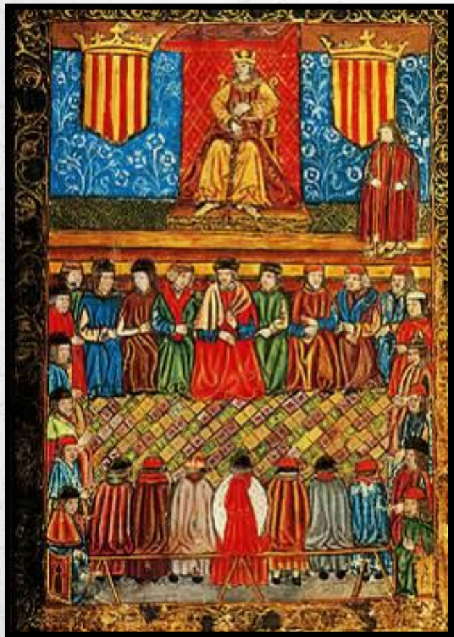
Каталонские кортесы. Средневековая миниатюра

собрание представителей сословий, в состав которого входили даже крестьяне. Кортесы утверждали налоги и участвовали в принятии законов.