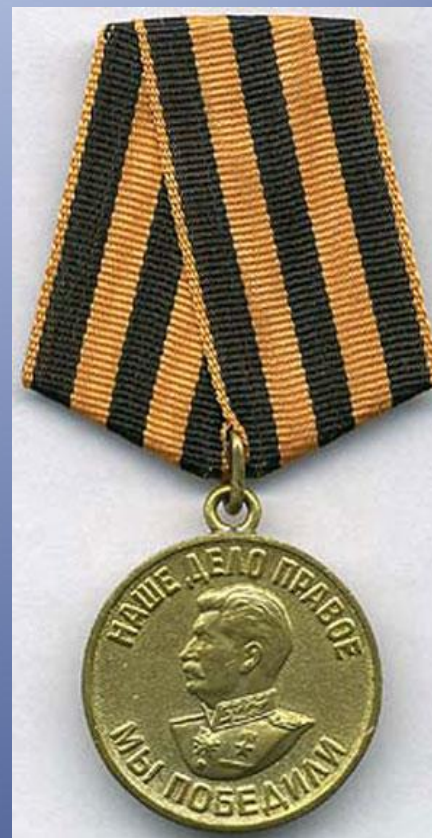
Медаль «За победу над Германией»