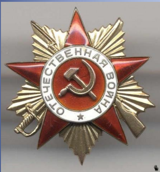
«Орден Отечественной войны I степени»