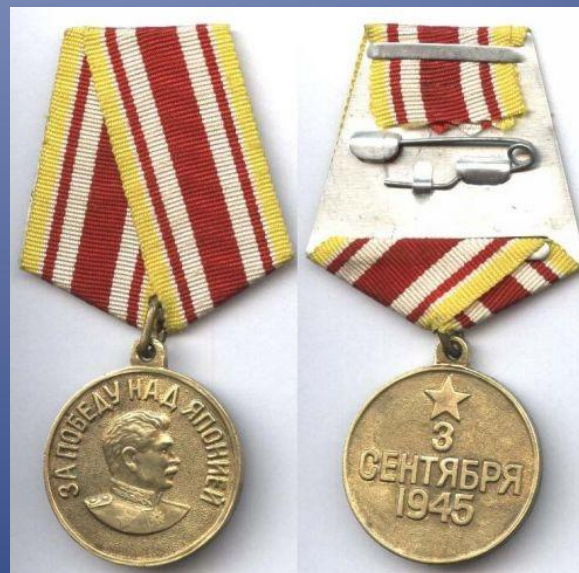
«Медаль за победу над Японией»