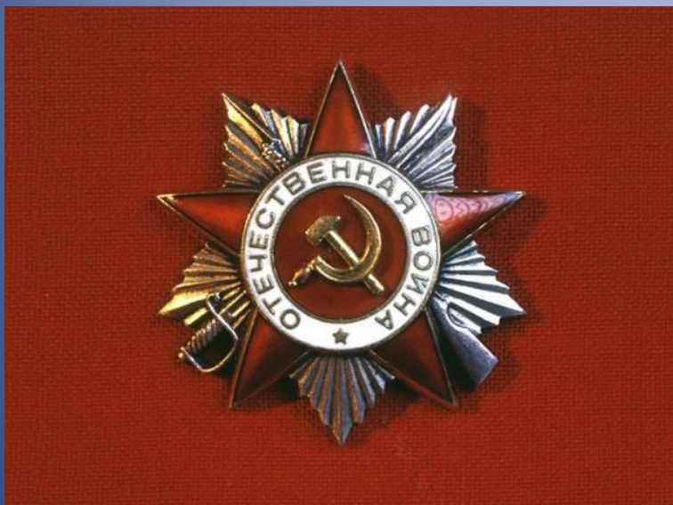
«Орден Отечественной войны II степени»