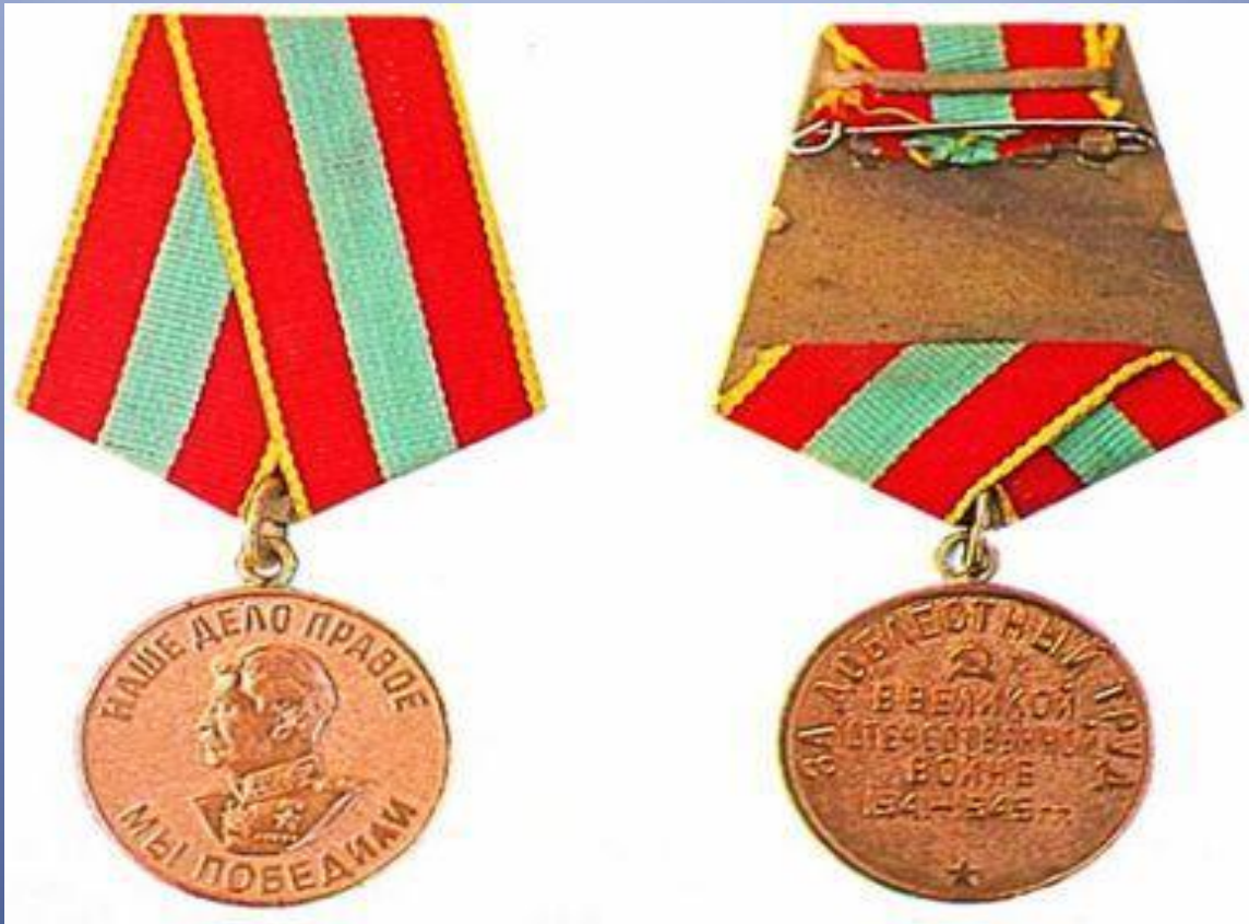
«Медаль за доблестный труд»