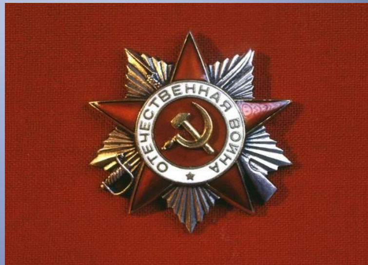
«Орден Отечественной войны II степени»