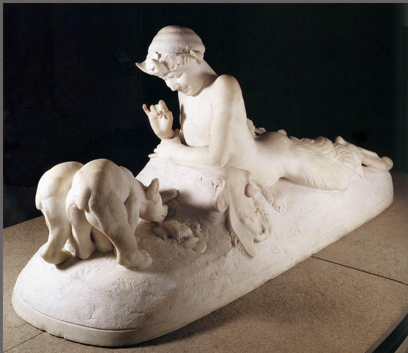
Пан и медвежата.1867 г.