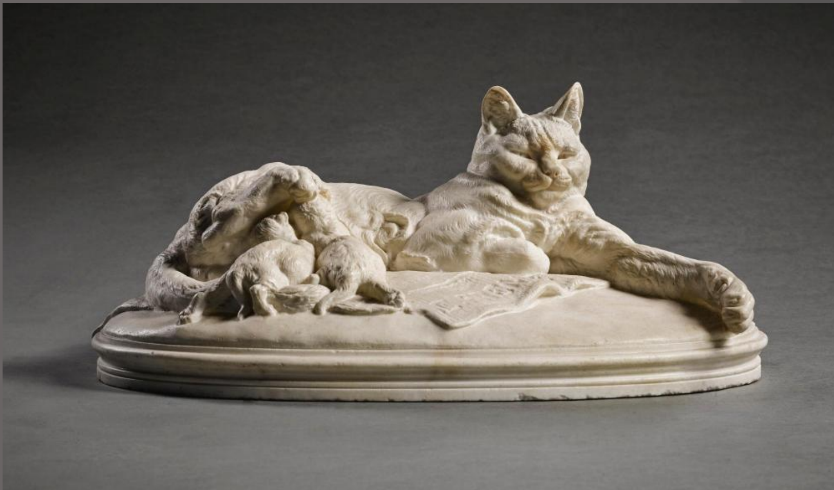
«Кошка кормит своих котят»