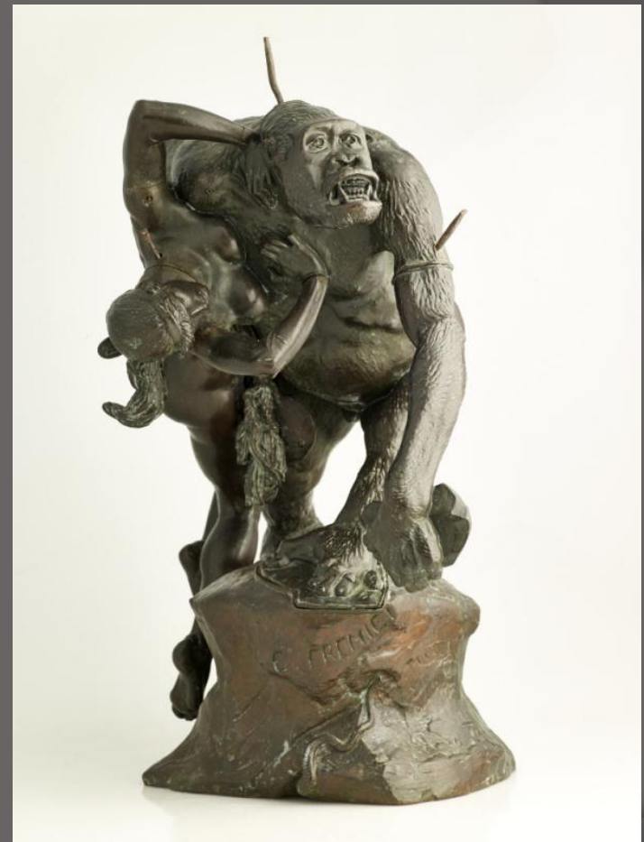
«Горилла, похищающая женщину».