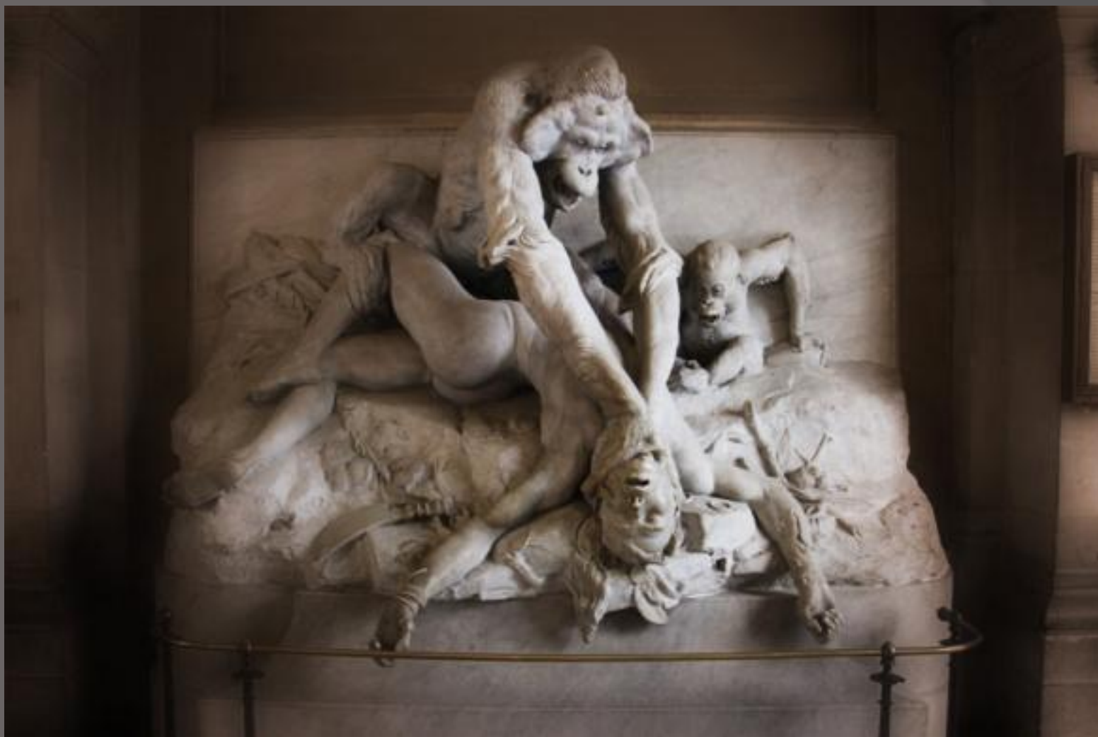
Орангутан душа дикий Борнео (1895)