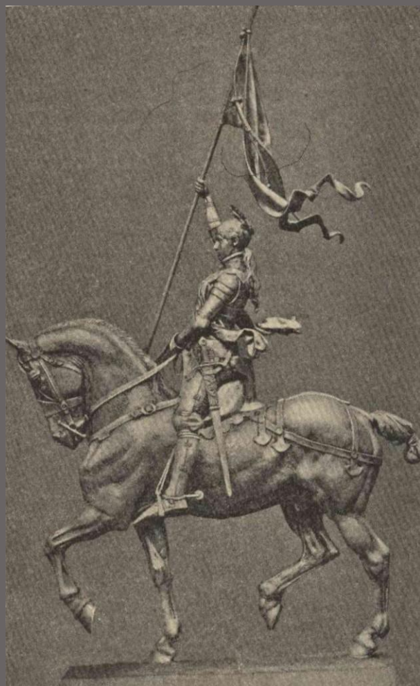
Статуя Жанны Д'Арк, воздвигнутая на Площади Пирамид в Париже. 1874 год.