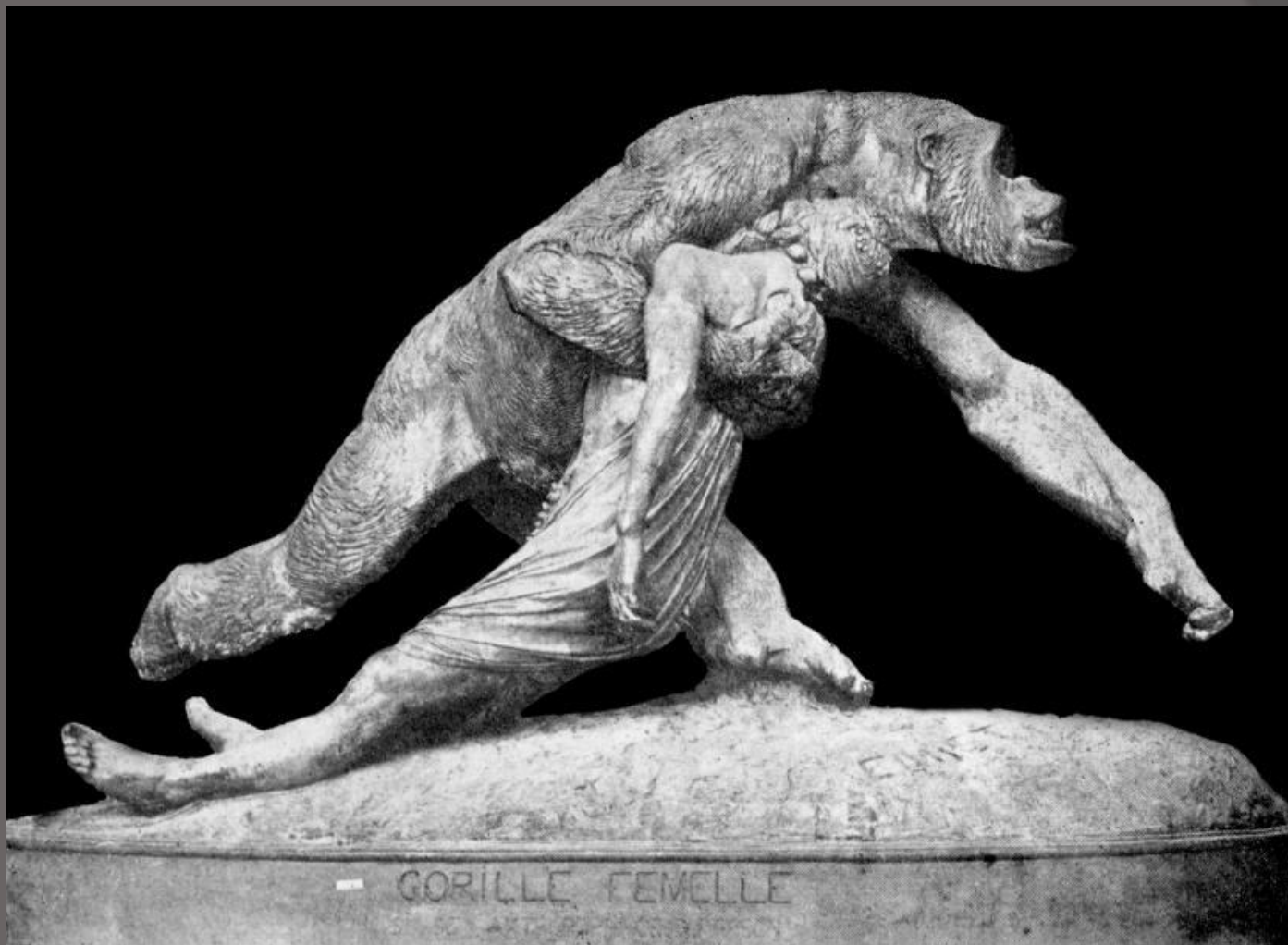
Горилла, похищающая негритянку (салон 1859 г.)