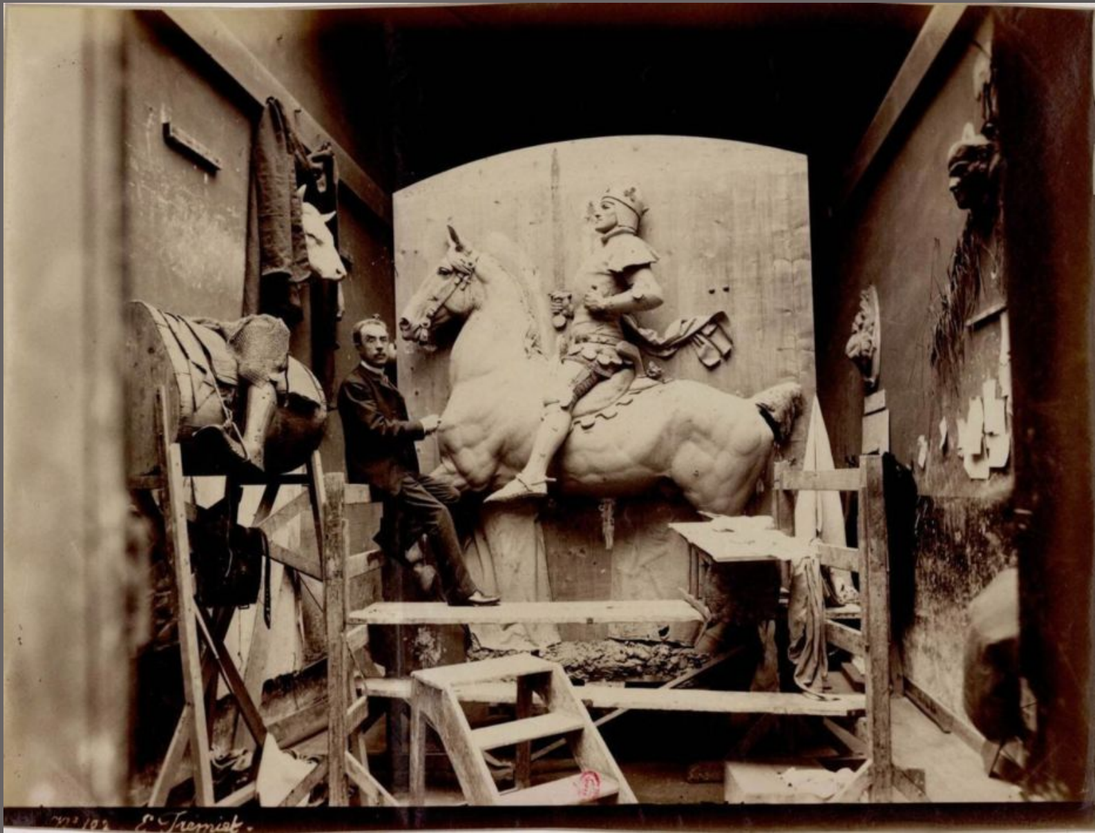
no 102 E. Fremont