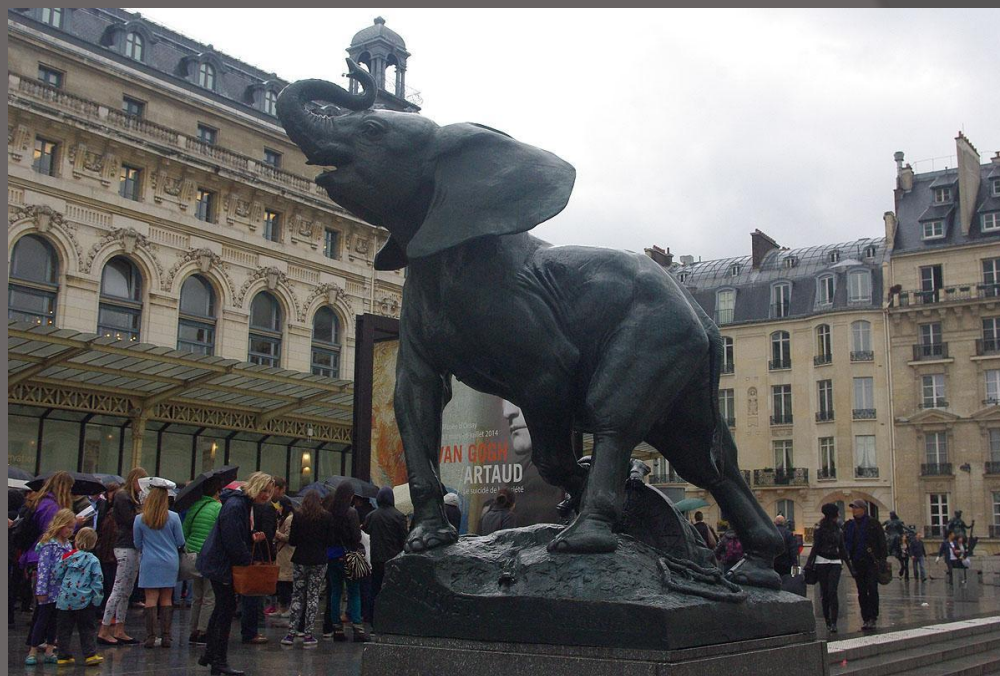
Молодой Пойманный Слоненок 1878