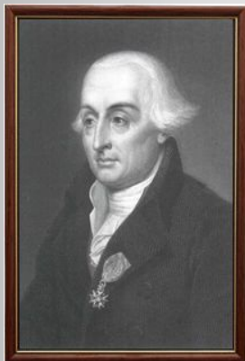
Жозеф Луи Лагранж (1736 – 1813)