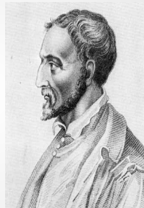
Джероламо Кардано (1501 – 1576)