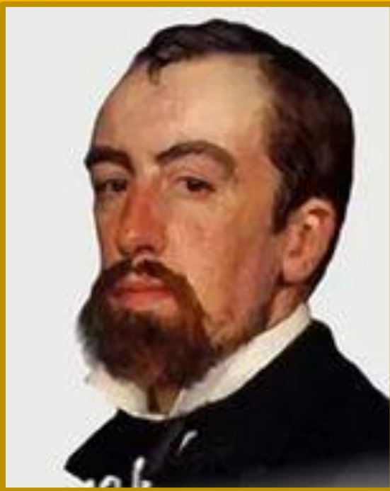
Василий Дмитриевич Поленов

Это один из выдающихся русских художников. Он родился в Петербурге ,в культурной дворянской семье .Систематические занятия живописью начались для него в 12 лет. Выполняя волю отца, Поленов поступил в Петербургский университет, получил юридическое образование, но одновременно по вечерам он занимался в Академии художеств, которую так же с успехом закончил.. С 1882 года художник преподавал в Московском училище живописи.