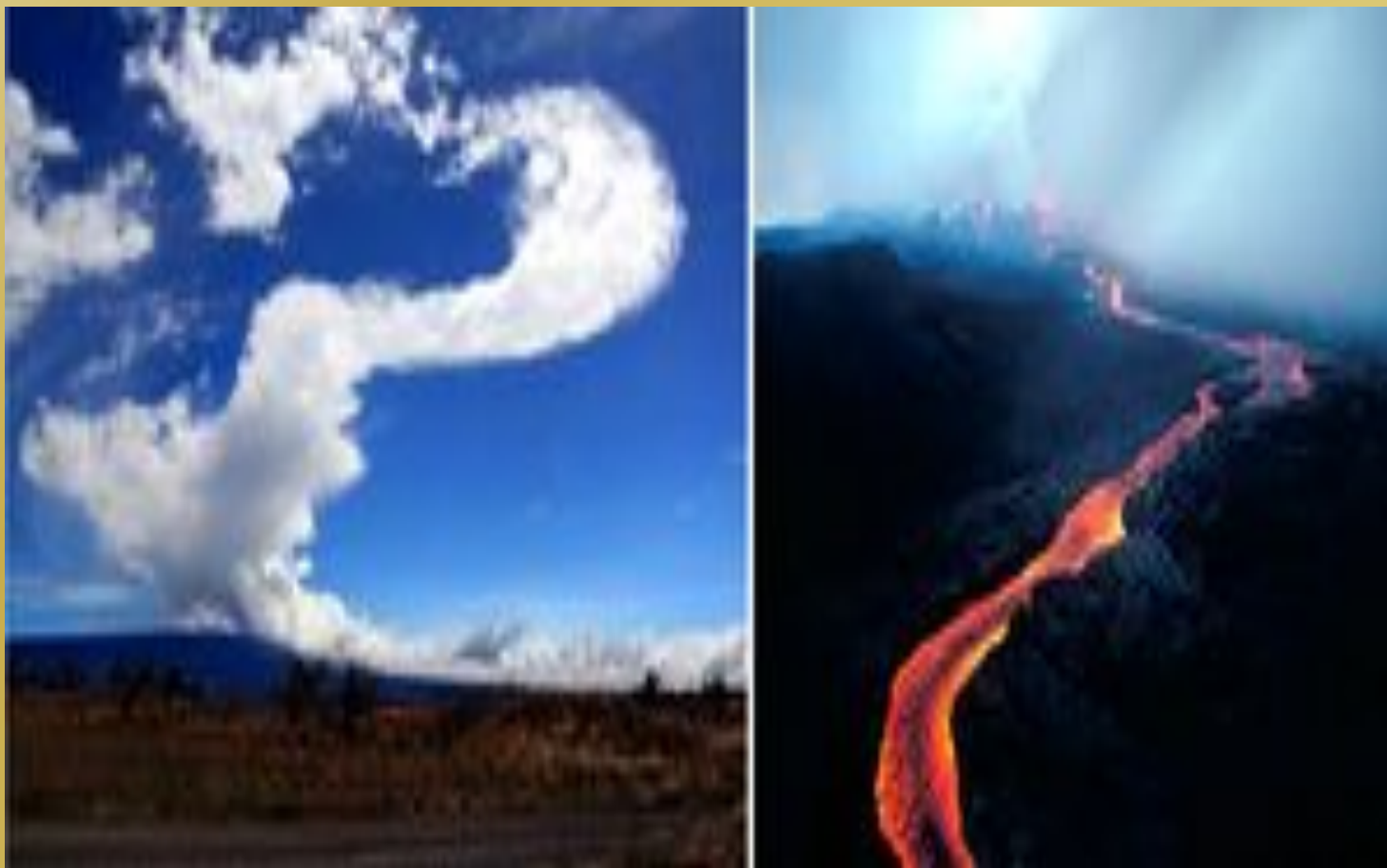
Мауна-Лоа ("длинная гора")