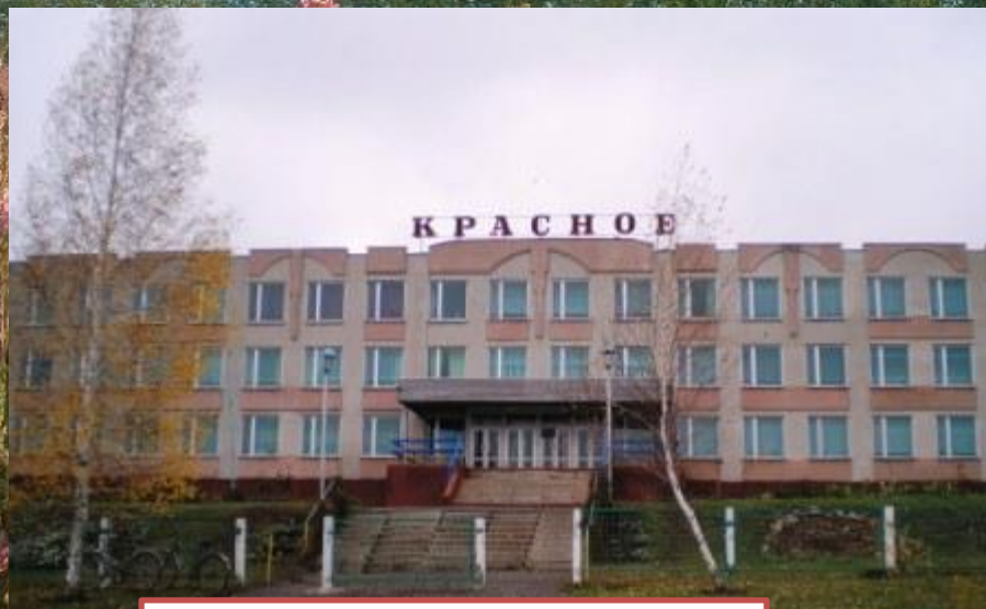
Здание новой школы

Мы учимся всю жизнь, не считая десятка лет, проведенных в школе.