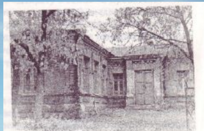
Одно из зданий земской школы