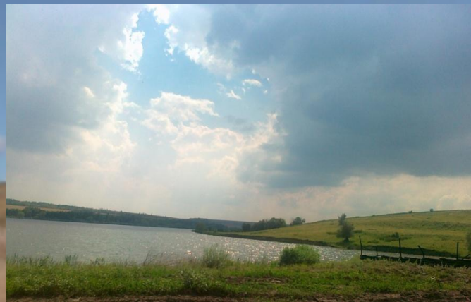
Современный вид пруда