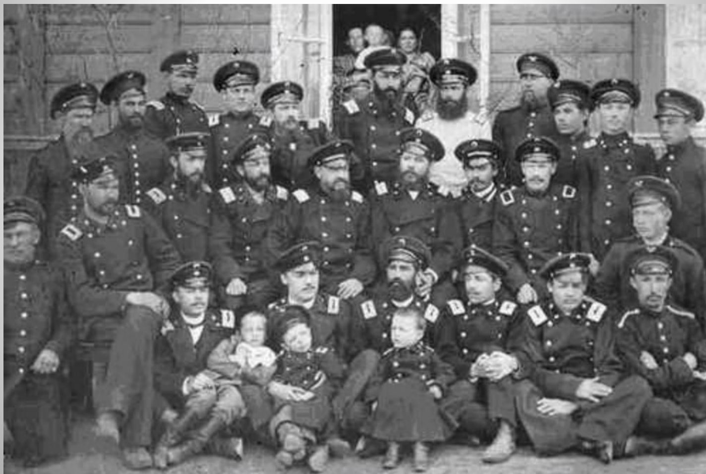
Служащие почтово-телеграфного ведомства г. Читы

14 активных работников почты и телеграфа были привлечены к военному суду и за подрыв устоев самодержавия приговорены к смертной казни. Казнь заменили разными сроками каторги.