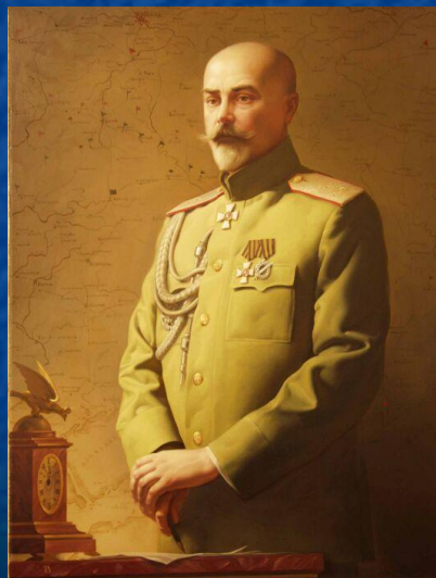
Генерал А. И. Деникин