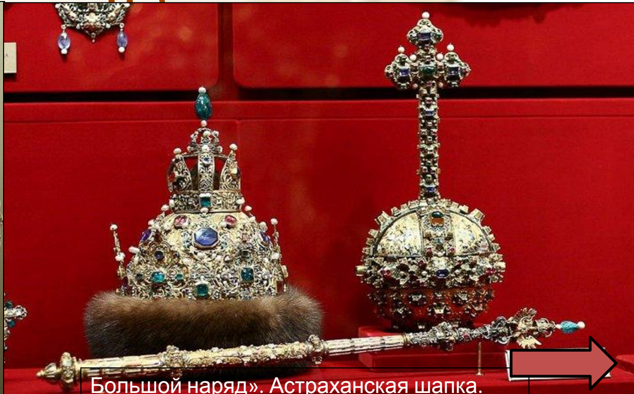
Большой наряд». Астраханская шапка. 1627 г