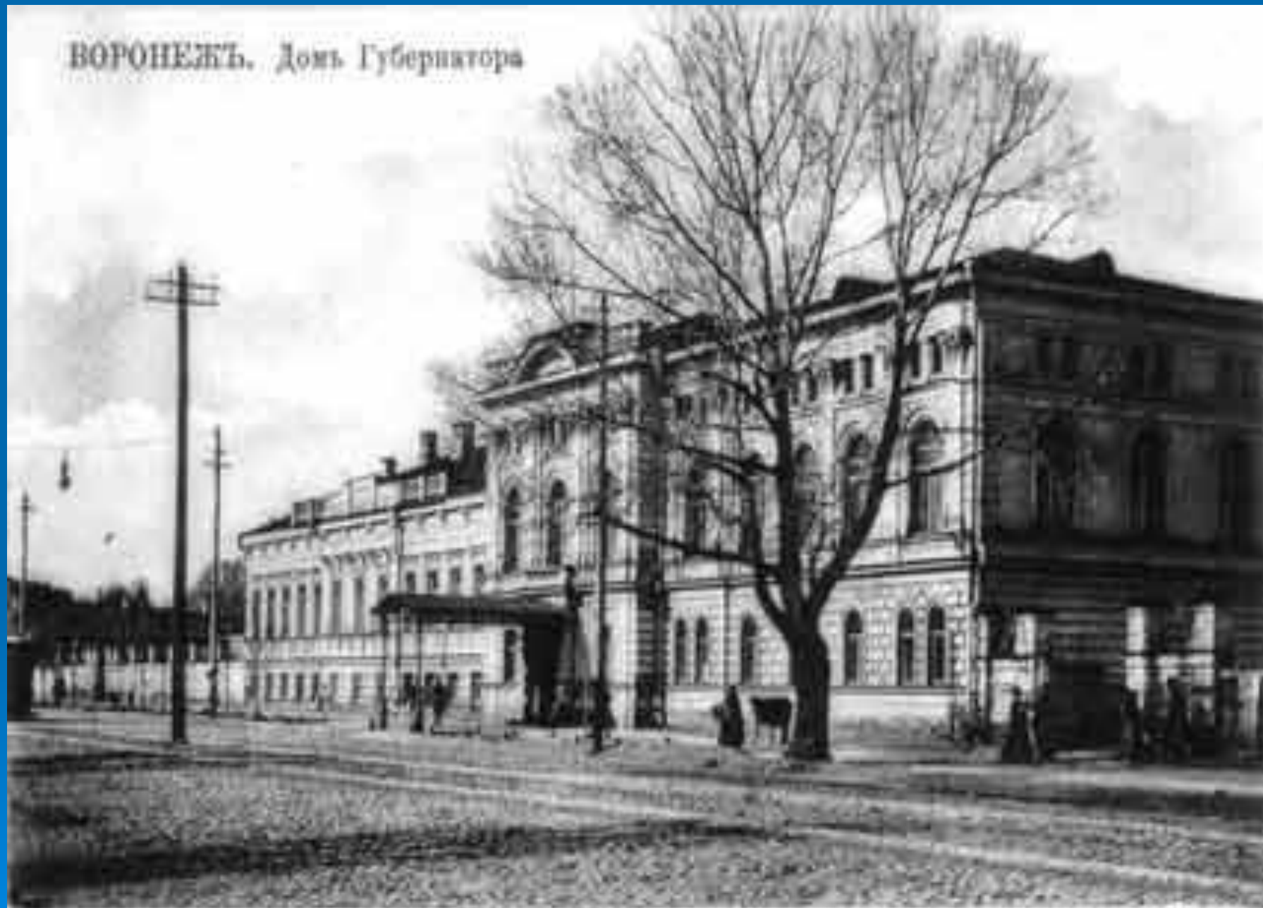
ВОРОНЕЖЪ. Домъ Губернатора