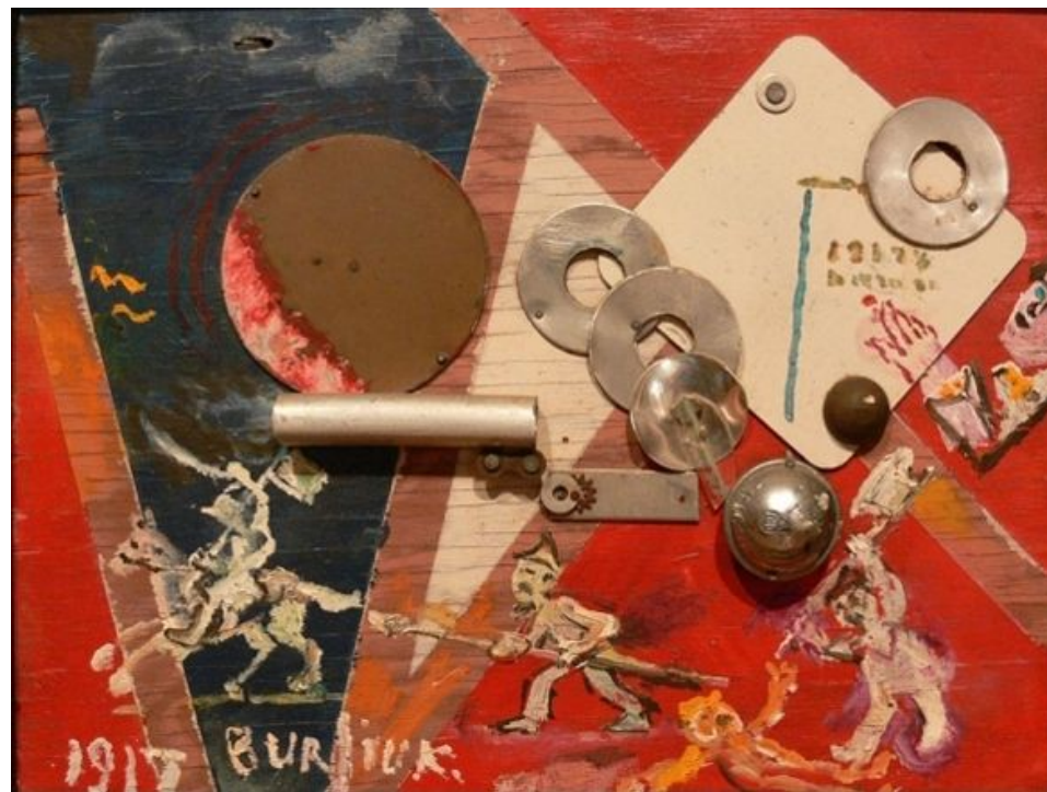
Д. Бурлюк. Коллаж «Революция». 1917