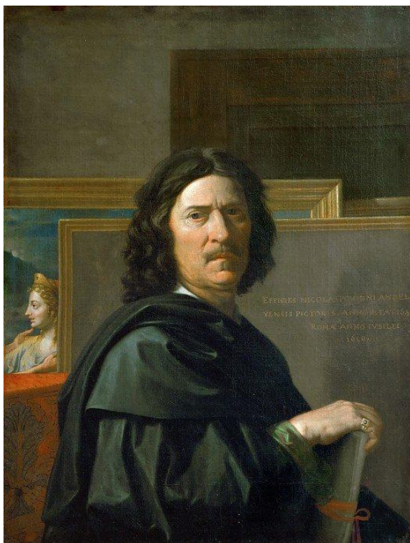
Н. Пуссен. Автопортрет. 1650