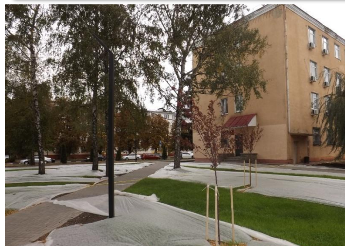
г. Строитель – сквер «Городской»