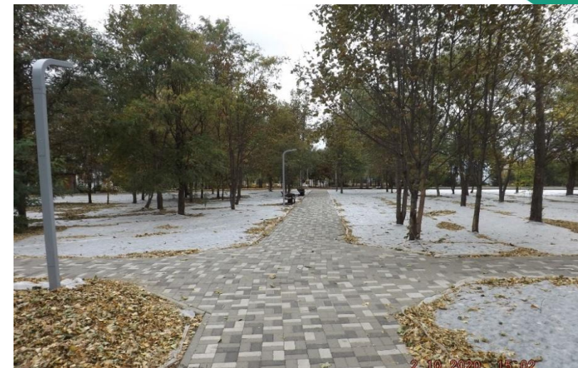
г. Строитель – парк «Сретенский»