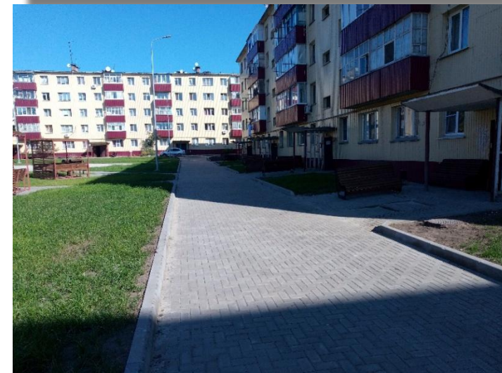
пгт. Пролетарский, микрорайон Ватутина