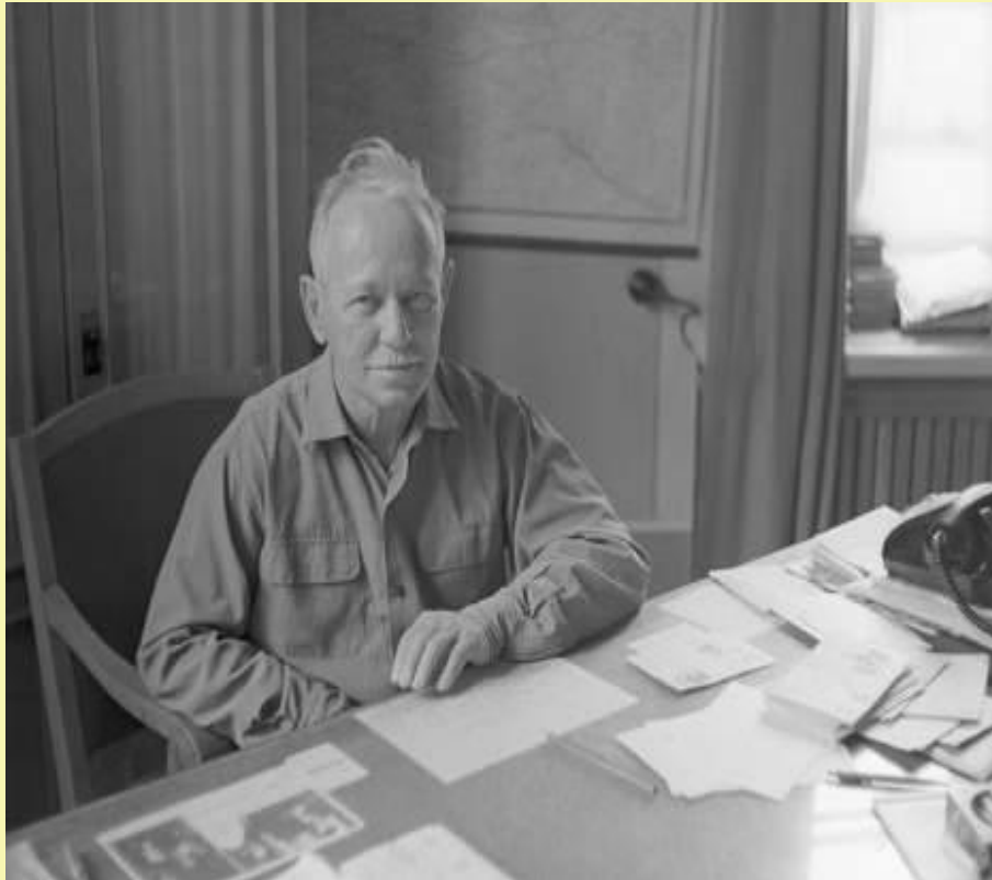
Михаил Александрович Шолохов (1905-1984)