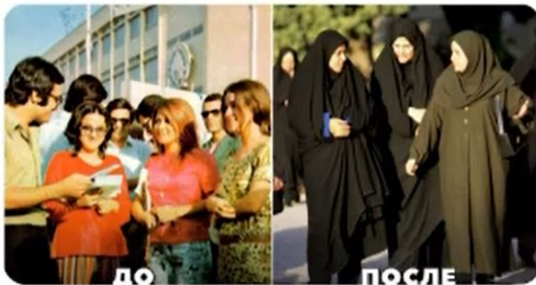
ДО ПОСЛЕ Исламская революция в Иране, 1979