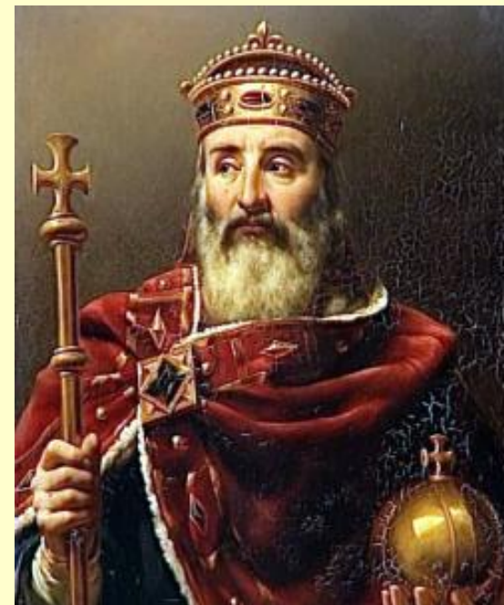
Карл Великий (768-814 гг.)