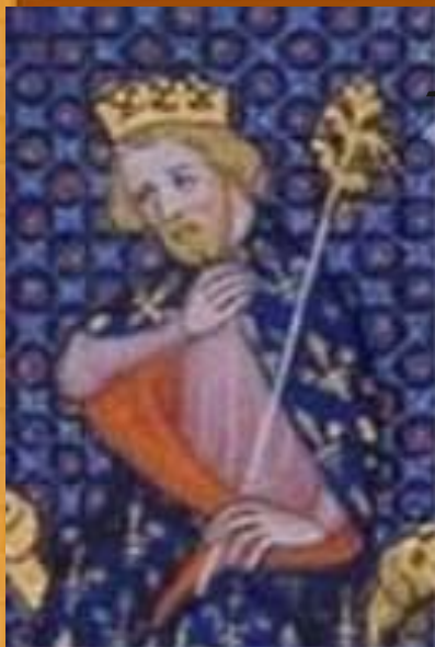
Карл Мартелл (715-741 гг.)