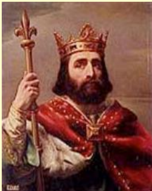
Пипин Короткий (741-768 гг.)

Основатель династии Каролингов, разгромил арабов при Пуатье в 732 г.