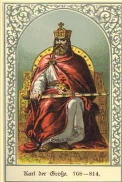
Karl der Große, 768–814.

« Возникновение и распад империи Карла Великого. Феодальная раздробленность »