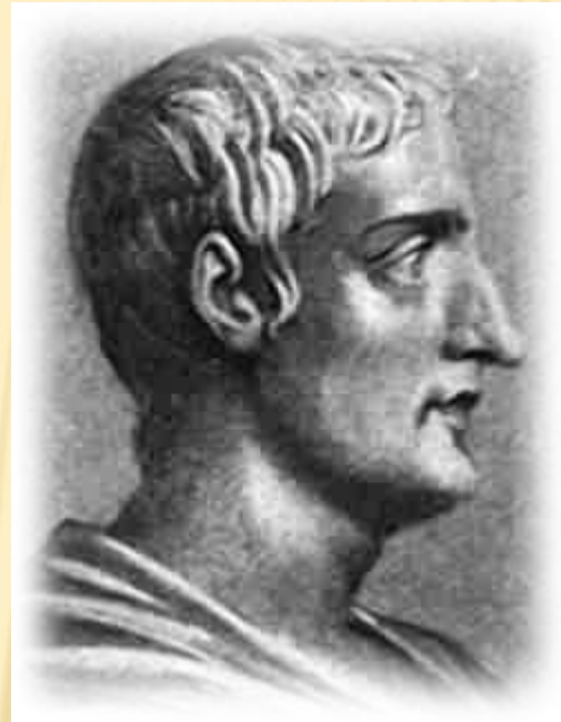
Доміцій Ульпіан (Давньоримський правник та державний діяч часів правління династії Северів)