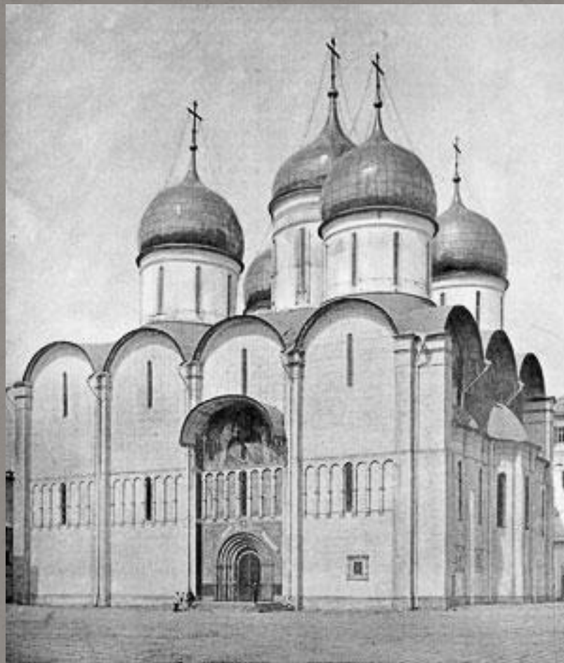
Успенский собор в Москве