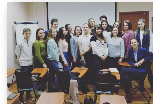
Профорientационный проект «ПРОФИ»