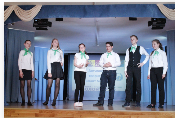
Итоговый слет РДШ Петродворцового района «Активность, творчество, талант молодых!»