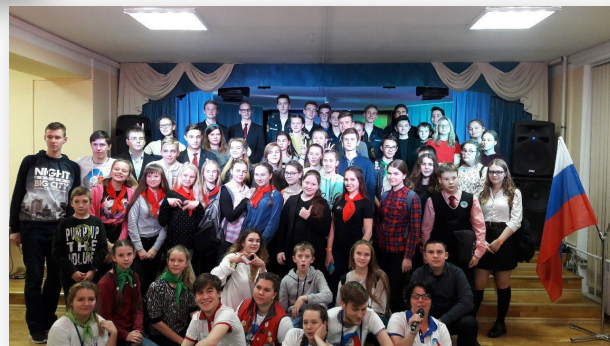
II открытый слет РДШ «В единстве наша сила!»