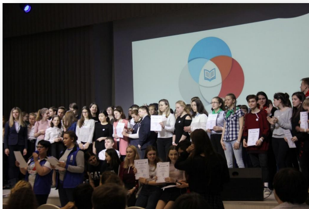
Слет лидеров Петродворцового района «Ты в теме!»

городская научно-практическая конференция НОВЫЕ ПУТИ РАЗВИТИЯ ДОПОЛНИТЕЛЬНОГО ОБРАЗОВАНИЯ