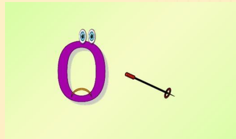
Ноль без палочки