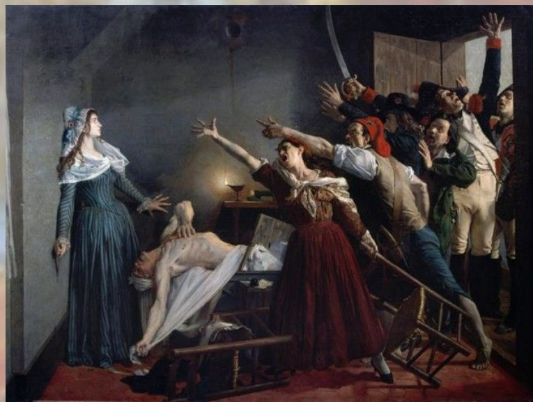
Жан- Жозеф Виртс