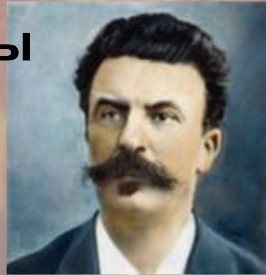
Ги де Мопассан