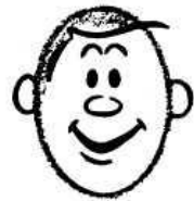
HAPPY OR AMUSED