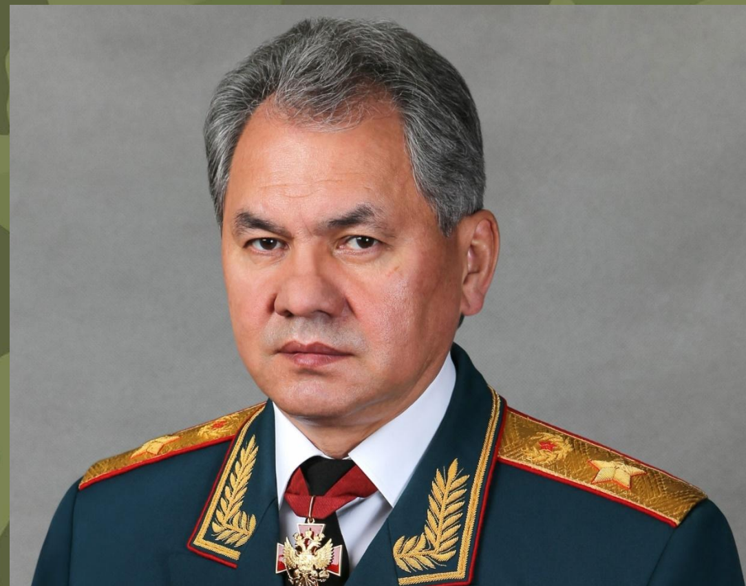
Министр обороны РФ Шойгу Сергей Кужугетович

Министр обороны является прямым начальником всего личного состава Вооруженных Сил РФ и несет персональную ответственность за выполнение задач, возложенных на министерство. По наиболее важным вопросам жизни и деятельности Вооруженных Сил РФ он издает приказы и директивы, а также вводит в действие положения, наставления, другие правовые акты, регламентирующие различные вопросы жизни, быта и деятельности войск. Министр обороны управляет Вооруженными Силами через Министерство обороны и Генеральный штаб Российской Федерации.