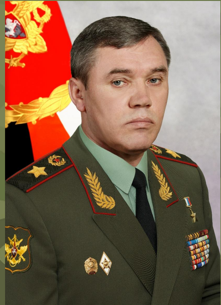
Начальник Генерального штаба ВС РФ Герасимов Валерий Васильевич

Генеральный штаб готовит также план применения и мобилизационный план Вооруженных Сил и Федеральную государственную программу оперативного оборудования территории страны в целях обороны. Он устанавливает количественные нормы призыва на военную службу, военные сборы, осуществляет анализ и координацию проведения в стране мероприятий по воинскому учету, подготовке граждан к военной службе и их призыву на военную службу и военные сборы. В целях обороны и безопасности Генеральный штаб организует проведение разведывательной деятельности, мероприятий по поддержанию боевой и мобилизационной готовности Вооруженных Сил Российской Федерации и др.