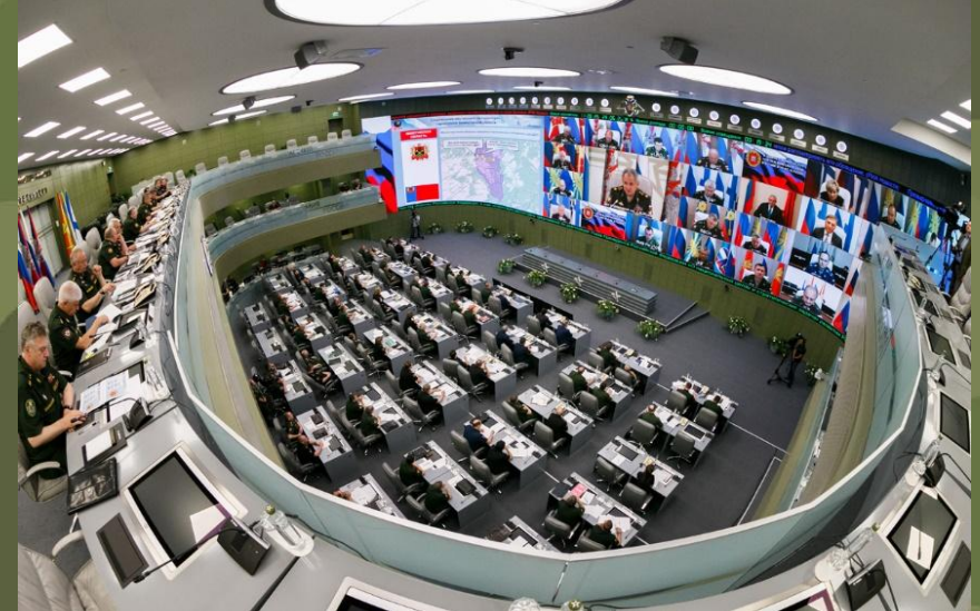
Министерство обороны РФ