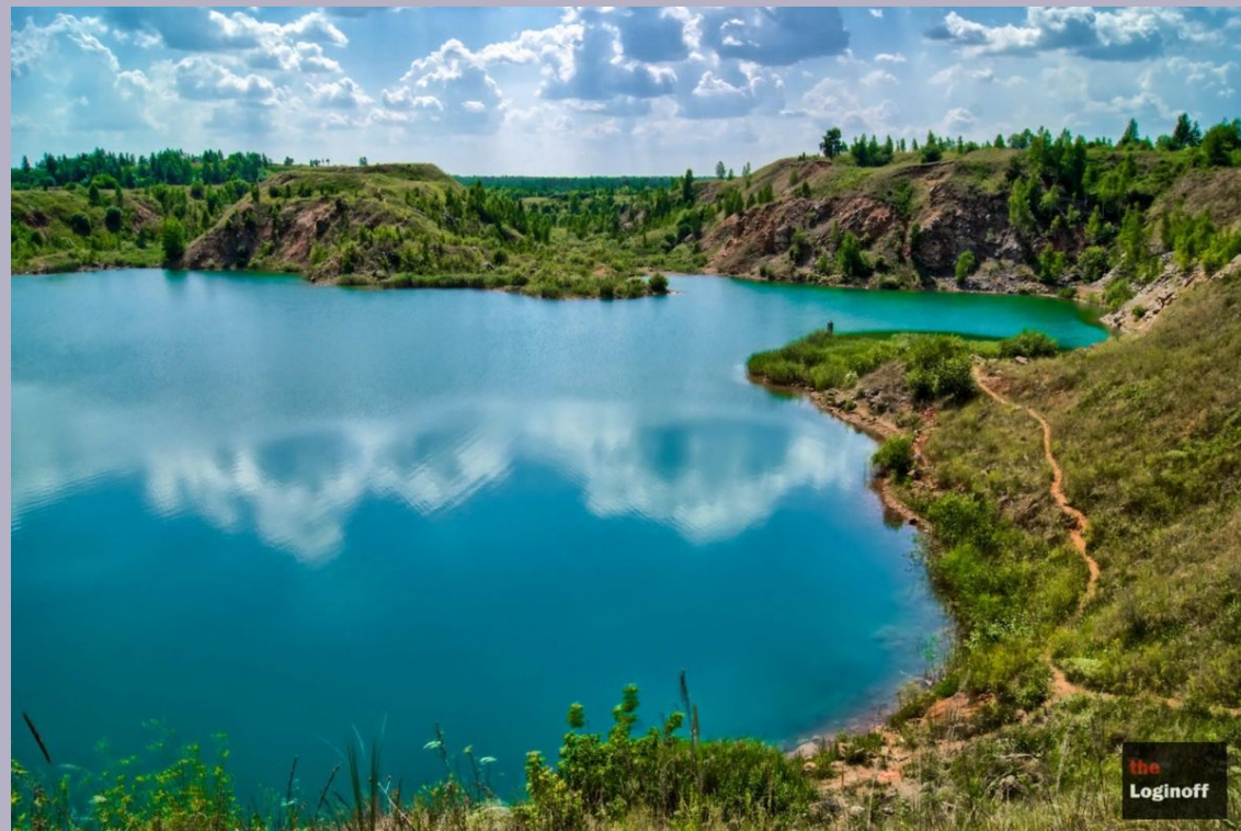
Зянгяр куль – Голубое озеро.