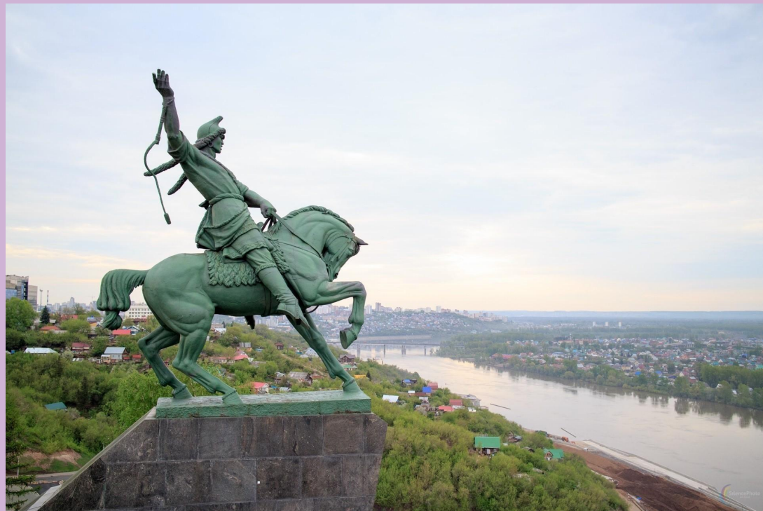
Памятник Салавату Юлаеву